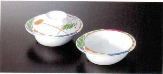
★M-352REP 小鉢 150×136×43 69 300cc ¥3,630 ★M-129REP 蓋 125×36 ¥1,090