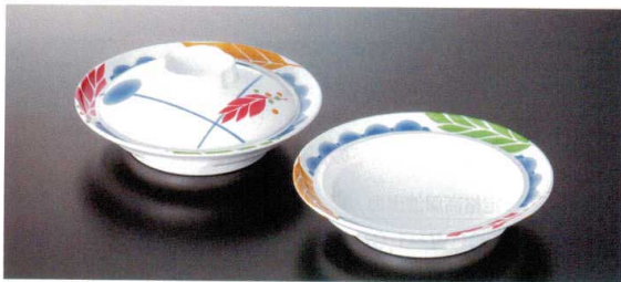
★SM102REP 16.5cm深皿(身) 151 165×35 61 200cc ¥2,420 ★FF102REP 蓋 133×38 ¥1,310