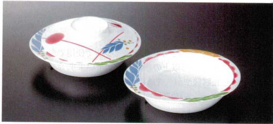
★M-351REP 中皿 173×158×36 62 350cc ¥3,820 ★M-127REP 蓋 148×36 ¥1,380