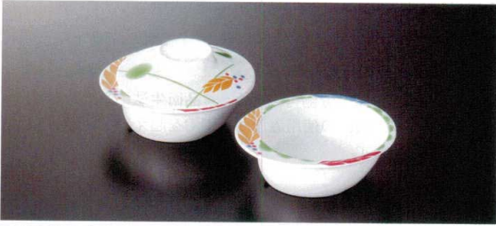
★M-353REP 小鉢 132×118×43 71 240cc ¥3,440 ★M-353FREP 蓋 117×34 ¥1,180