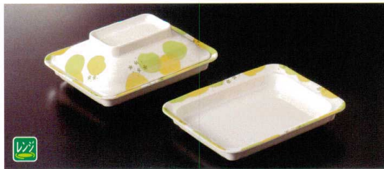
★ M-905NEAS 角皿(身) 173×135×29 ④ 64 230cc ¥2,380 ★ M-906NEA 角皿(蓋) 156×118×45 ¥2,020