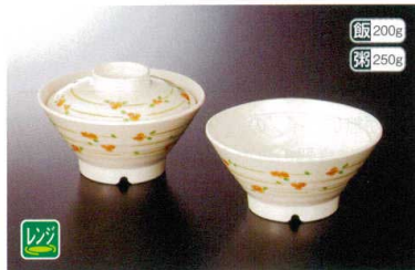
★ M-907NEAS 飯碗(身) 140×69 ④ 89 450cc ¥2,090 ★ M-908NEA 飯碗(蓋) 124×37 ¥1,450