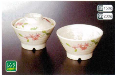
★ M-909NEAS 飯碗(身) 123×69 ④ 89 360cc ¥2,000 ★ M-910NEA 飯碗(蓋) 109×37 ¥1,370

ココが Point 手びねり風ならではの温かみのあるデザイン。趣ある質感はしっくりと手になじみます。