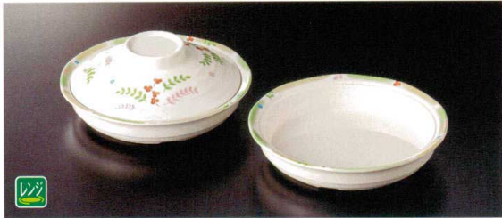
★ M-901NEAS 丸深皿(身) 166×34 ④ 65 310cc ¥2,420 ★ M-902NEA 蓋 148×42 ¥1,700 共用蓋A ●U-51AN丸すのこ(119頁掲載)が対応します。