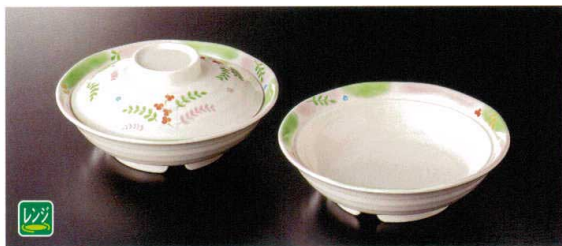
★ M-903NEAS 煮物碗(身) 172×50 ④ 76 330cc ¥2,600 ★ M-902NEA 蓋 148×42 ¥1,700 共用蓋A