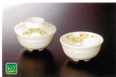
★ M-911NEAS 丸小鉢(身) 110×52 ④ 77 280cc ¥1,500 ★ M-912NEA 丸小鉢(蓋) 111×32 ¥1,380

ココが Point 手びねり風ならではの温かみのあるデザイン。趣ある質感はしっくりと手になじみます。