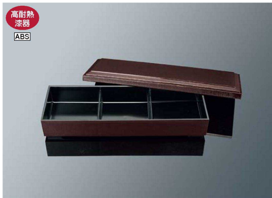
656-1 布目三つ仕切弁当 うるみ内黒 組 378×138×71 ¥4,300 身 ¥2,500 / 蓋 ¥1,800 ※仕切は一体成形のため外せません。