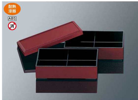
F18R 銀泉2段松花堂弁当箱 朱 組 260×137×112 ¥5,400 ※仕切は一体成形のため外せません。 F18B 身 ¥1,850 F18B 身 ¥1,850 F18C 蓋 ¥1,700