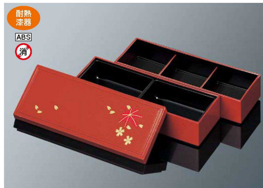
655-1 段付長手2段弁当 春秋 組 308×106×104 ¥6,100(仕切込) 655-1B 身1段 ¥1,200 655-1B 身1段 ¥1,200 655-1C 蓋 ¥1,260 655-1K 三つ仕切 ¥820 655-1KW 二つ仕切¥1,620(2個入り)

シンプルモダン 和風 洋風 中華 病院・高齢者 UD・PPカバ 弁当箱 高強化磁器 大型食器・取り皿 テーブルグッズ キッズ&スクール トレー