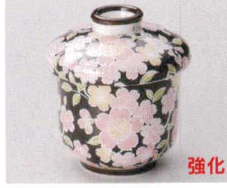
251-4-757 花友禅蒸し碗(小) 2,020円 6.5×8.5cm(150cc) 31627755