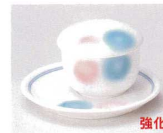
251-26-757 二色水玉蒸し碗 1,250円 φ7.3×6cm(130cc) 31609751