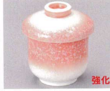
251-9-757 赤白タタキ蒸し碗(小) 2,100円 6.5×8.5cm(150cc) 31407755