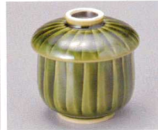
251-17-717 織部ソギ小むし碗 1,650円 7×8cm(150cc) 28315716