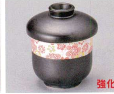
251-19-757 花帯黒蒸し碗(小) 2,020円 7.5×8.5cm(140cc) 31619755