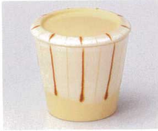
251-2-717 錆十草むし碗 2,000円 7.2×7cm(150cc) 32708712