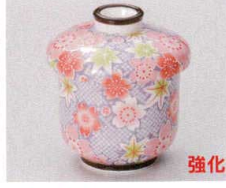
251-5-757 鹿子友禅蒸し碗(小) 2,020円 6.5×8.5cm(150cc) 31626755