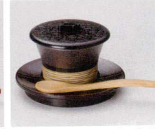
251-33-757 杵型赤巻蒸し碗(小) 1,600円 8.8×6cm(120cc) 31535755