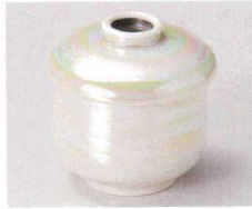
251-7-717 ラスター小蒸し碗 1,950円 7×8cm(150cc) 31107714