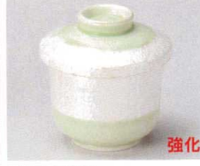
251-10-727 ヒワ釉真珠小むし碗 1,900円 7.3×8.5cm(150cc) 32640722