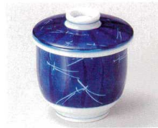
251-6-697 松葉小むし碗(有田焼) 2,000円 7.5×8cm(150cc) 5入 31121694