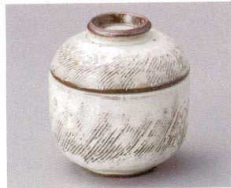
251-1-287 粉引櫛目小むし碗 2,300円 7.3×8cm 25101287