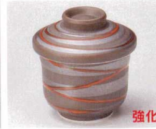
251-18-717 錆渦むし碗 2,000円 7.2×8.3cm(150cc) 31226711