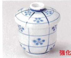
251-12-717 梨地市松梅むし碗 1,750円 6.3×8.3cm(130cc) 31105714