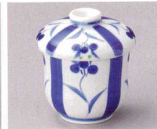
251-22-717 青立花小蒸碗 1,600円 6.5×8.5cm 25122717