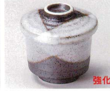
251-15-717 志野塗分むし碗(小) 1,600円 6.3×7.2cm(110cc) 31126714