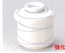
251-14-717 かすみ二色釉渦むし碗 1,750円 6.7×6.7×8cm(150cc) 32717702