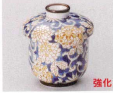
251-3-757 唐草蒸し碗(小) 2,020円 6.5×8.5cm(150cc) 31628755