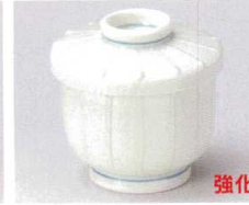
251-24-717 ヒワ磁一珍十草むし碗 1,580円 6.5×7.2cm(120cc) 32713792