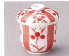
251-21-717 赤立花小蒸碗 1,600円 6.5×8.5cm 25121717