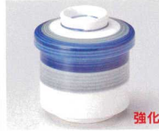
251-13-717 二色ラインむし碗 1,750円 6.7×8cm(150cc) 31437781