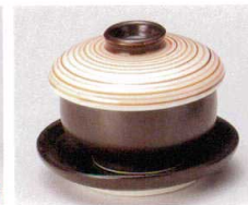
251-28-727 南蛮赤駒筋ミニミニむし碗 1,580円 7×6.2cm(120cc) 32333723