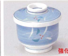
251-23-717 彫唐草むし碗 1,620円 6.5×7.2cm(120cc) 32711712