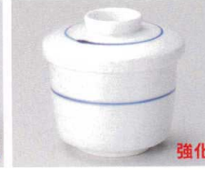
251-25-197 一本筋小むし碗 1,600円 6.8×7.4cm(130cc) 31424195