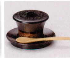
251-30-757 杵型茶蒸し碗(小) 1,600円 8.8×6cm(120cc) 31532755