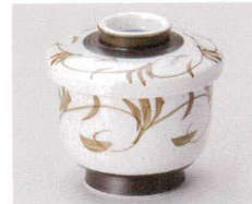
251-11-717 梨地唐草蒸碗 1,780円 6.3×8.3cm(120cc) 31623715