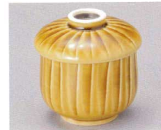
251-16-717 黄瀬戸ソギ小むし碗 1,650円 7×8cm(150cc) 28314716