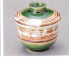
251-20-657 織部流し小むし碗 1,480円 6.8×7.8cm(150cc) 28317656