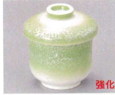
251-8-757 ヒワ白タタキ蒸し碗(小) 2,100円 6.5×8.5cm(150cc) 31408755