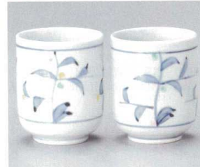
345-17-717 古染花湯呑(大) 950円 6.7×9cm(220cc) 48843711 345-18-717 古染花湯呑(小) 850円 6.7×7.8cm(180cc) 48844711