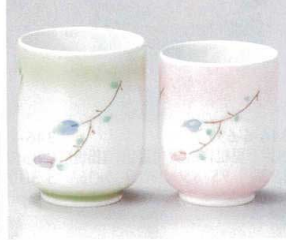
345-15-717 一珍花日和湯呑(大) 950円 6.2×8.5cm(180cc) 48839711 345-16-717 一珍花日和湯呑(小) 900円 6×7.7cm(150cc) 48840711