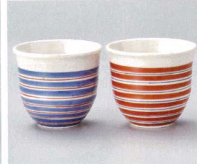
345-19-557 手描胸筋 青湯呑 1,060円 8.5×7.5cm(250cc) 39941556 345-20-557 手描胸筋 赤湯呑 1,060円 8.5×7.5cm(250cc) 39942556