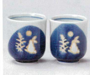
345-11-717 兎湯呑(大) 1,050円 7.2×7.9cm(190cc) 48723711 345-12-717 兎湯呑(小) 900円 6.8×7.6cm(180cc) 48724711