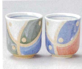
345-9-717 志野三色重ね湯呑(大) 1,050円 7.2×8cm(200cc) 48727711 345-10-717 志野三色重ね湯呑(小) 900円 6.8×7.7cm(180cc) 48728711