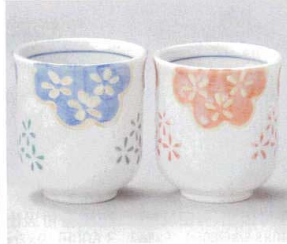
345-5-717 志野花小紋湯呑(大) 1,050円 7.2×8cm(200cc) 48825711 345-6-717 志野花小紋湯呑(小) 900円 6.8×7.7cm(180cc) 48826711