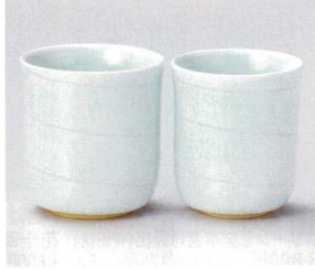
345-7-717 やすらぎ湯呑(大) 1,000円 7.4×8cm(210cc) 44105714 345-8-717 やすらぎ湯呑(小) 950円 6.5×7.8cm(150cc) 44106714