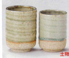
345-13-717 灰釉湯呑(大) 950円 6.7×9cm(230cc) 48811711 345-14-717 灰釉湯呑(小) 850円 6.2×8.5cm(150cc) 48812711