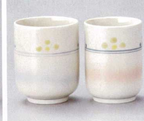
345-39-757 萩風早春ブルー湯呑(大) 680円 6.7×9.3cm(220cc) 10入 39945756 345-40-757 萩風早春ピンク湯呑(小) 620円 6×8.4cm(180cc) 10入 39946756