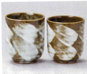
345-1-357 益子荒刷毛湯呑(大) 1,200円 7.2×8.7cm(220cc) 10入 49835352 345-2-357 益子荒刷毛湯呑(小) 1,150円 6.9×8.1cm(180cc) 10入 49836352