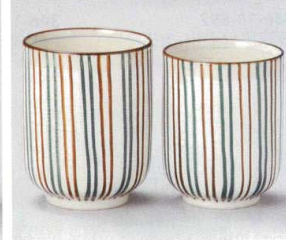
345-31-717 新二色十草湯呑 大 850円 6.9×8.8cm(230cc) 46717713 345-32-717 新二色十草湯呑 小 800円 6.4×8cm(170cc) 46718713