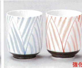
345-27-717 ゴス間取十草長湯呑 850円 6.6×8.4cm(200cc) 44123714 345-28-717 赤絵間取十草長湯呑 850円 6.6×8.4cm(200cc) 44124714