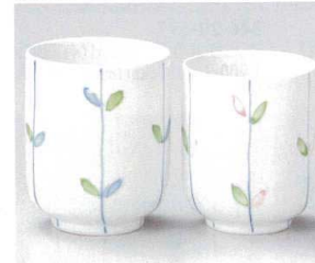
345-25-717 一珍若芽湯呑(大) 900円 6.3×8.6cm(180cc) 48845711 345-26-717 一珍若芽湯呑(小) 850円 6.1×7.8cm(150cc) 48846711