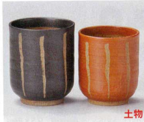
345-3-717 彫トクサ(黒)湯呑(大) 1,000円 6.8×8.3cm(210cc) 48725711 345-4-717 彫トクサ(赤)湯呑(小) 1,000円 6.5×7.6cm(170cc) 48726711