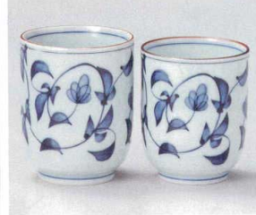
345-23-197 花唐草タル型湯呑(大) 880円 6.5×8.1cm(180cc) 48941191 345-24-197 花唐草タル型湯呑(小) 790円 6.1×7.7cm(160cc) 48942191