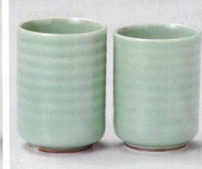
345-29-197 天龍寺青地湯呑(大) 880円 6.4×8.9cm(200cc) 20入 4932191 345-30-197 天龍寺青地湯呑(小) 830円 6.1×8.2cm(180cc) 20入 50146192