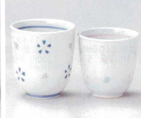
345-21-717 花吹雪湯呑(大) 900円 7.8×8cm(230cc) 48833711 345-22-717 花吹雪湯呑(小) 850円 7.5×7cm(170cc) 48834711