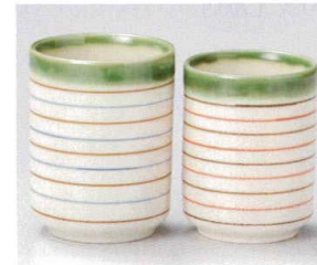
345-33-717 織部胸筋湯呑(大) 850円 6.6×8.6cm(230cc) 46719713 345-34-717 織部胸筋湯呑(小) 800円 6.1×8cm(170cc) 46720713