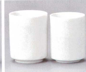
345-37-287 白釉切立湯呑(大) 700円 7.2×9cm(280cc) 100入 39845286 345-38-287 白釉切立湯呑(小) 650円 6.5×8.7cm(200cc) 100入 39846286