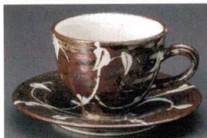
錆ツタ絵抜き 土物

495-1-217 コーヒーC/S 3,900円 69405213 495-2-217 カップ 2,250円 8.9×11.2×7.3cm(240cc) 69406213 495-3-217 受皿 1,650円 14.9cm 49503217