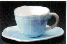
ブルー色十草 土物

495-7-217 コーヒーC/S 3,200円 69503213 495-8-217 カップ 1,900円 7.5×10.4×6.8cm(200cc) 69504213 495-9-217 受皿 1,300円 14.5cm 49509217