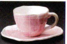
ピンク色十草 土物

495-10-207 タタラコーヒーC/S 3,150円 10.2×8.2×5.9cm(190cc) 66239204 495-11-207 タタラコーヒー碗 1,750円 190cc 66240204 495-12-207 受皿 1,400円 14.6×12.6×1cm 49512207