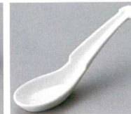
565-38-187 中レンゲ 250円 13.6×4.6cm 73849185