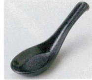
565-21-187 黒結晶片掛レンゲ 420円 14.5×4.6cm 56521187