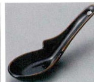
565-23-187 天目アゴ付穴レンゲ 520円 15.5×4.7cm 75743181