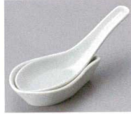
565-12-187 第二レンゲ 260円 14.3×4.2cm 73935185