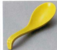
565-18-187 黄釉ラーメンレンゲ 520円 18×5.4cm 74304184