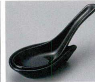
565-26-187 天目受台 490円 9×5.4cm 75748181