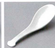
565-36-187 F型中レンゲ 320円 14×4.6cm 73851185