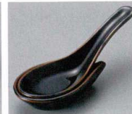
565-25-187 天目レンゲ 410円 14×4.6cm 75747181