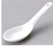
565-6-727 白磁レンゲ 280円 15.2×4.7cm 75644721