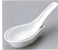
565-11-187 青磁F型受台 470円 9×5.4×2cm 73932185