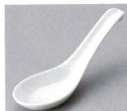
565-7-187 反掛レンゲ大 280円 15.7×5cm 70307186