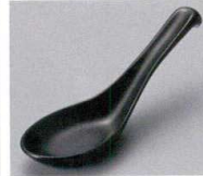
565-20-187 黒マット片掛レンゲ 420円 14.5×4.6cm 73918185