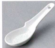
565-9-187 アゴ付穴レンゲ 230円 15.3×4.5cm 75642181