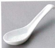
565-1-187 6.0新掛レンゲ 630円 18×5cm 75638181