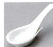
565-34-187 手平反レンゲ大 350円 15×4.4cm 74332184