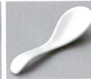
565-32-187 手平スリレンゲ大 350円 13.5×3.9cm 73945185