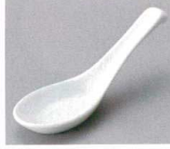
565-5-187 片掛レンゲ 330円 14.5×4.6cm 75651181