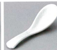
565-30-187 底丸レンゲ大 270円 15.2×4.4cm 70337186