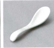
565-33-187 手平スリレンゲ小 330円 12×3.3cm 73945185