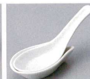
565-35-187 手平反レンゲ小 330円 13×3.5cm 74333184