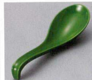
565-17-187 緑釉ラーメンレンゲ 520円 18×5.4cm 74305184