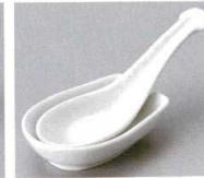
565-40-187 5.0並レンゲ 300円 15×4.1cm 73957185