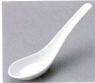
565-2-187 6.0レンゲ 740円 18×5.2cm 75641181