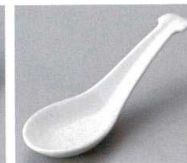
565-37-187 F型受台 400円 9×5.4×2cm 73852185