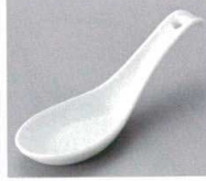
565-4-187 反穴レンゲ 310円 14×4.5cm 74250184