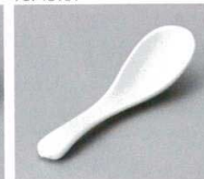
565-31-187 掛レンゲ 360円 16.5×4.2cm 70330186