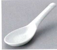
565-3-187 両掛レンゲ 340円 14×4.4cm 75643181