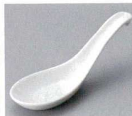
565-8-187 反掛レンゲ 240円 14×4.6cm 75649181