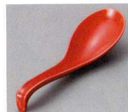
565-16-187 赤釉ラーメンレンゲ 650円 18×5.4cm 74303184