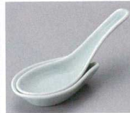
565-10-187 青磁F型中レンゲ 390円 14×4.6cm 73931185