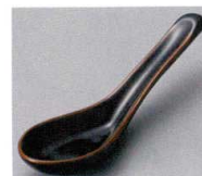
565-22-187 天目6.0新掛レンゲ 740円 17.5×4.5cm 75742181