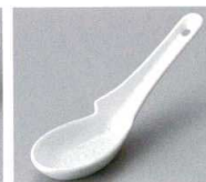
565-29-187 青レンゲ 430円 14×4.6cm 75733181