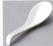
565-19-187 白釉ラーメンレンゲ 400円 18×5.4cm 74306184