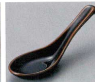
565-24-187 天目片掛レンゲ 420円 14.8×4.6cm 75744181