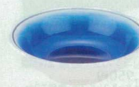
572-15-967 133花鉢ブルーぼかし銀ライン 2,775円 13.3×4cm 57215967