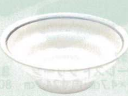
572-12-967 122段付丸小鉢ホワイトパール銀ライン 2,850円 12.2×4.4cm 57212967