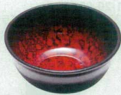
572-6-967 110丸深小鉢紅みかげ 2,775円 11×5cm 57206967