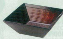
572-14-967 120スクエア小鉢ブラウンアキア 3,600円 12×12×4.3cm 57214967