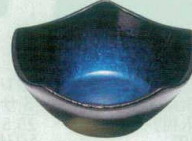
572-13-967 120五角鉢深海アキア 3,675円 12×12×5.5cm 57213967