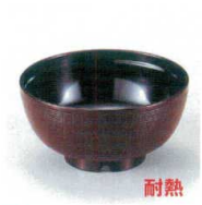
576-26-937 [TA] ニュー千筋ケヤキ椀 溜 (通気穴付) 850円 12×6.2cm(290cc) 200入 74028935