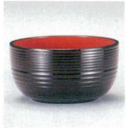
576-36-937 [A] 4.7寸四季井 黒千筋内朱 950円 14.1×7.2cm(800cc) 120入 74108935

[A] ABS樹脂 耐熱温度/60°C~70°C 電子レンジ不可、熱風消毒保管庫不可 [TA] 耐熱ABS樹脂 耐熱温度/80°C~110°C 食器洗浄機対応、消毒保管庫使用不可 [PET] PET樹脂 耐熱温度/100°C~110°C 食器洗浄機対応