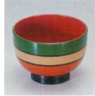
576-9-937 [A] 寿汁椀 歌舞伎内朱 1,300円 10.4×7.3cm(350cc) 300入 74010935