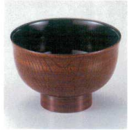
576-33-937 [A] 羽反木目井 柘 1,300円 13.3×8.7cm(870cc) 80入 74105935