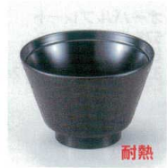
576-10-937 [TA] 3.3寸布目汁椀 黒 700円 10.4×6.5cm(230cc) 200入 74019935