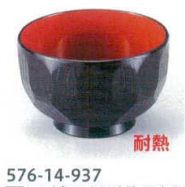
576-14-937 [TA] 3.6寸亀甲木目汁椀 黒内朱 850円 10.9×7cm(380cc) 200入 74023935