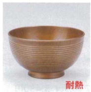
576-29-937 [PET] 4寸千筋タスク椀 ケヤキ 1,450円 11.8φ×6.6cm(430cc) 200入 71135936