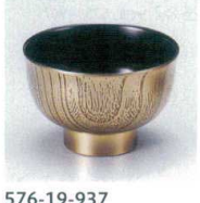
576-19-937 [A] 羽反木目汁椀 金彫 1,200円 11.2φ×7.4cm(330cc) 100入 71122936