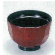
576-4-937 [A] 3.2寸亀甲汁椀 溜内黒 430円 9.6×6.8cm(200cc) 300入 74004935