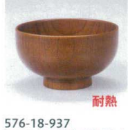
576-18-937 [TA] 3.8寸木目汁椀 内外ケヤキ 1,200円 11.6×7cm(400cc) 200入 74029935