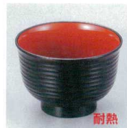
576-5-937 [TA] 3.3寸美里荒筋汁椀 黒内朱 800円 10×6.9cm(210cc) 200入 74013935