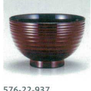
576-22-937 [A] 3.8寸四季椀 うるみ千筋内黒 950円 11.4×7.1cm(400cc) 200入 74031935