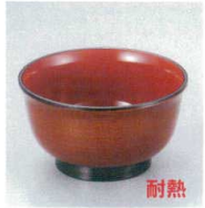
576-35-937 [TA] 4.5寸美里飯椀 春慶刷毛目内朱 1,550円 13.4×7.5cm(550cc) 150入 74107935