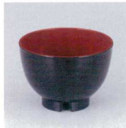
576-1-937 [A] 3.2寸汁椀 黒木目内朱 (通気穴付) 220円 9.6×6.8cm(270cc) 400入 74007935