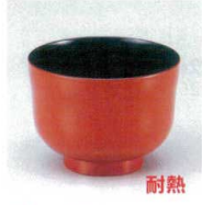
576-7-937 [PET] ひさご汁椀 朱内黒 850円 10φ×7.5cm(350cc) 200入 57607937