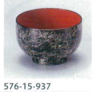
576-15-937 [A] 大和汁椀 黒乱糸内朱 1,150円 11φ×7.3cm(400cc) 100入 71119936