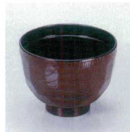
576-2-937 [A] 3.1寸亀甲汁椀 うるみ内黒 450円 9.4×7cm(220cc) 300入 74002935