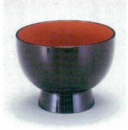
576-32-937 [A] 4.5寸高台好み椀 黒内朱 1,500円 13.5φ×10.2cm(700cc) 120入 57632937