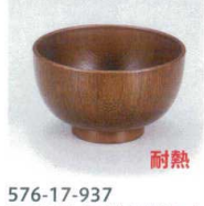
576-17-937 [TA] 3.5寸木目汁椀 内外ケヤキ 1,100円 10.6φ×6.3cm(300cc) 200入 71129936