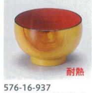
576-16-937 [TA] 布袋汁椀 花梨内朱 1,400円 11φ×7cm(370cc) 100入 71120936