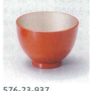
576-23-937 [A] 九頭竜汁椀 朱内銀溜 1,300円 11.8φ×8.6cm(500cc) 100入 71132936