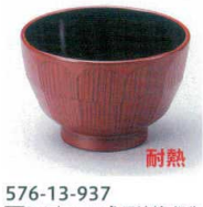
576-13-937 [TA] 3.6寸ハツリ亀甲汁椀 銀朱 1,250円 11×7.2cm(400cc) 100入 74021935