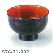
576-21-937 [A] 羽反木目汁椀 黒内朱 750円 11.2×7.4cm(330cc) 200入 74026935