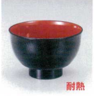
576-31-937 [TA] ニュー羽反木目井 黒内朱 1,200円 13.3×8.7cm(870cc) 80入 74104935