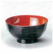
576-25-937 [TA] 4寸亀甲汁椀 黒内朱 250円 11.5×6.6cm(320cc) 400入 74005935