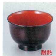
576-6-937 [TA] 3.3寸美里汁椀 溜内朱 950円 10×6.9cm(210cc) 200入 74015935