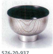
576-20-937 [A] 羽反木目汁椀 銀彫 1,200円 11.2φ×7.4cm(330cc) 100入 71123936