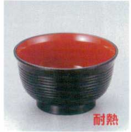
576-34-937 [TA] 4.5寸美里千筋飯椀 黒内朱 1,300円 13.4×7.5cm(550cc) 150入 74106935