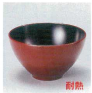
576-28-937 [TA] 4寸つぼみ木目椀 銀朱内黒 1,000円 12×6.9cm(370cc) 200入 74034935