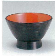
576-12-937 [A] 3.8寸宝生汁椀 黒内朱 700円 11.7×7cm(300cc) 100入 74012935