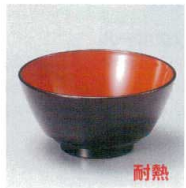
576-27-937 [TA] 赤坂飯椀 黒内朱 800円 12.2×6.2cm(360cc) 200入 74033935