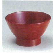
576-11-937 [A] 3.6寸宝生汁椀 吟朱 650円 11×7cm(260cc) 100入 74011935