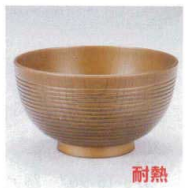
576-30-937 [PET] 4.5寸千筋タスク椀 ケヤキ 1,800円 13.7φ×7.7cm(570cc) 100入 71136936