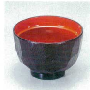
576-3-937 [A] 3.2寸亀甲汁椀 黒内朱 400円 9.6×6.8cm(200cc) 300入 74003935