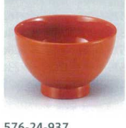
576-24-937 [A] 4寸乱筋木目井 総染朱 750円 12×7.7cm(470cc) 200入 74039935