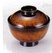
583-3-937 [TA]越前椀 アクアブラウンエース塗 3,050円 11.1φ×9.9cm(240cc) 100入 58303937