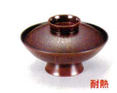
583-24-937 [TA]5.5寸煮物椀 柘布目(段無) 2,700円 16.7×10.1cm(500cc) 60入 74321935