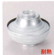
583-8-937 [TA]4寸華富士椀 銀白刷毛目 3,100円 11.6φ×9cm(290cc) 100入 71707936