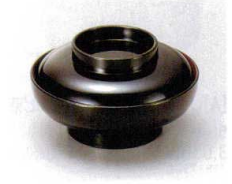
583-26-937 [A]5.5寸大平椀 黒内朱天黒 1,900円 16.6×9.5cm(430cc) 60入 74323935