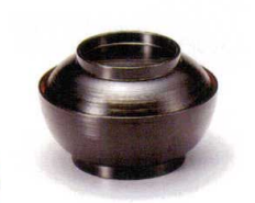
583-20-937 [TA]4.5寸刷毛目椀 黒内朱 1,900円 13.9φ×9.2cm(410cc) 100入 58320937