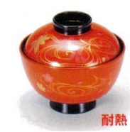
583-4-937 [TA]越前椀 朱竜田川 3,500円 11.1φ×9.9cm(240cc) 100入 74235935