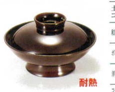
583-23-937 [TA]5.5寸羽反煮物椀 溜(段無) 2,750円 16.3×9.4cm(490cc) 60入 74320935