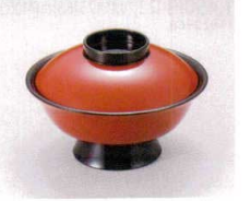
583-30-937 [A]5.5寸低型大名椀 朱つば黒(段無) 2,700円 16.3×10.9cm(600cc) 60入 74327935