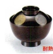
583-5-937 [TA]新越前椀 黒日月 2,800円 11.1×9.7cm(290cc) 100入 74236935