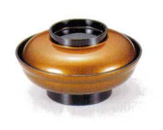
583-28-937 [A]新広輪井 (小) 金梨地つば黒 2,600円 17.6×9.8cm(440cc) 50入 74325935