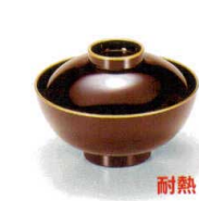
583-15-937 [TA]4寸平仙才椀 マロン天金 1,700円 12.5φ×8.7φ×6.1cm(260cc) 100入 71716936