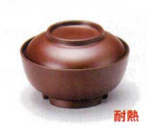
583-22-937 [TA]5寸菓子椀 (水切有) 総銀朱 2,700円 15φ×9.8cm(550cc) 60入 71722936