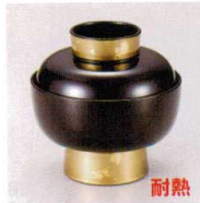
583-2-937 [TA]古代椀 黒高台帯金箔 3,500円 11.3×11.2cm(250cc) 100入 74301935