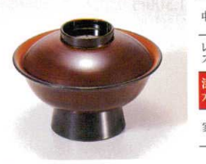
583-32-937 [A]5.5寸大名椀 溜刷毛目内朱(段無) 2,800円 16.3×11.5cm(600cc) 60入 74329935