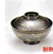
583-16-937 [TA]4寸平仙才椀 銀箔ちらし 2,550円 12.5φ×8.7φ×6.1cm(260cc) 100入 71717936