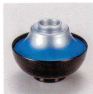
583-7-937 [TA]4寸華富士椀 銀石目青 3,150円 11.6φ×9cm(300cc) 100入 58307937