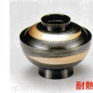
583-11-937 [TA]御殿吸椀 銀地一筆 2,300円 12×10cm(290cc) 100入 74303935