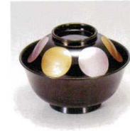
583-10-937 [TA]4寸羽反吸椀 黒金雅日月5H塗 4,000円 11.9φ×8.5cm(230cc) 100入 58317937