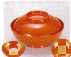
583-19-937 [TA]柳椀 朱見返り松春秋 6,000円 13.5φ×7.7cm(280cc) 100入 58319937