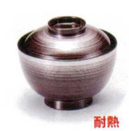
583-1-937 [TA]3.8寸仙才椀 茶 銀刷毛目 3,000円 11.1×9.7cm(300cc) 100入 74234935