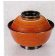
583-9-937 [TA]ニュー羽反吸椀 茜雲 2,850円 11.7φ×8.5cm(230cc) 100入 58309937