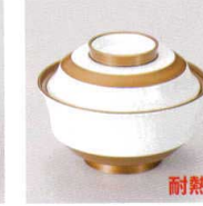
583-18-937 [TA]4寸天竜寺椀 白金独染 4,700円 12φ×8.8φ×6.1cm(280cc) 100入 71710936