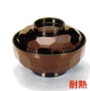
583-14-937 [TA]4寸真亀甲吸椀 溜 1,500円 12×8.6cm(250cc) 100入 74308935