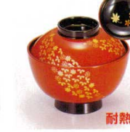
583-6-937 [TA]新越前椀 春秋帯春秋見返し付 4,600円 11.1×9.7cm(290cc) 100入 74238935