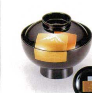
583-12-937 [TA]御殿吸椀 黒に色紙見返し付 4,200円 12φ×10cm(290cc) 100入 58312937