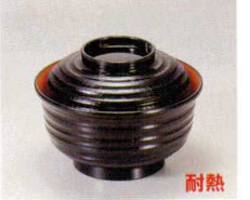
583-21-937 [TA]乱筋飯器 黒内朱 1,600円 13.5×10cm(420cc) 100入 74315935