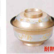
583-17-937 [TA]4寸天竜寺椀 シャンパン銀帯金箔 5,150円 12φ×8.8cm(280cc) 100入 71709936