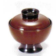
583-13-937 [A]高仙才吸椀 溜 1,600円 11.8×11.1cm(300cc) 100入 74302935