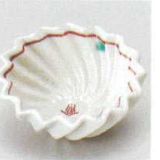
98-14-717 赤巻フリル珍味 950円 7×2.8cm 11904714