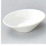
98-37-197 白磁石目2.7楕円鉢 750円 8.1×6.3×2.4cm 11142196