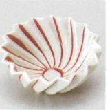
98-13-717 赤絵筋フリル珍味 950円 7×2.8cm 11905714