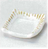
98-32-287 サビ十草二角小皿 600円 6.7×2cm 150入 30117282