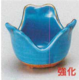
98-3-717 トルコ割山椒珍味 1,350円 6.1×4.2cm 11511701