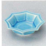
98-1-157 トルコ交趾八角千代久 3,100円 8.7×8.7×2.6cm 11102156