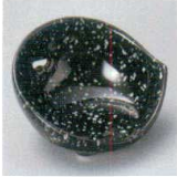
98-10-527 黒白吹かまくら珍味 1,150円 7.2×7×4.2cm 11108526