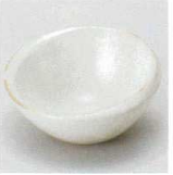
98-26-207 白マットM型珍味 630円 6.5×3.4cm 12922202