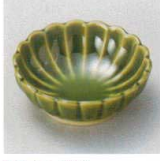
98-44-717 織部菊型珍味 370円 6.4×2.3cm 09844717