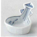
98-16-527 呉須絵びわ型珍味 990円 9×6.3×4.5cm 12202525