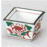
98-2-717 赤絵角珍味 1,950円 5×5×3cm 11619794