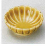
98-43-717 黄瀬戸菊型珍味 370円 6.4×2.3cm 09843717