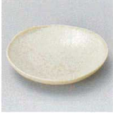
98-17-207 シルバー豆皿 850円 7.3×1.3cm 11131206