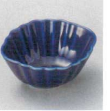
98-28-207 ネイビー楕円リンカ豆鉢 630円 8×6.8×3.7cm 09828207