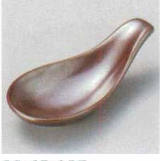
98-45-187 鉄赤片手珍味(大) 680円 11×5.3×2cm 09845187 98-46-187 鉄赤片手珍味(小) 540円 9×4.5×1.7cm 09846187