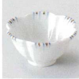
98-9-717 潤二色十草花型珍味 1,100円 7.3×3.7cm 12206715