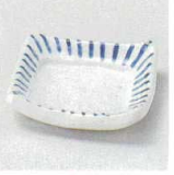
98-33-357 線十草角小皿 600円 7×6.8×1.7cm 29825353