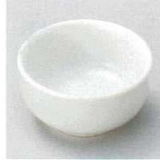
98-22-527 白磁丸千代久 850円 6.3×3.3cm 04816524