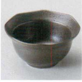
98-31-287 黒茶八角珍味 800円 8.7×8.7×4.4cm 100入 12128285