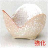
98-4-717 雪どけ三ツ葉小鉢(小) 1,200円 7.8×7.8×5.2cm 10634703