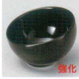
98-30-717 ブラック丸スラント珍味 550円 6.3×6.3×4.3cm 54210714