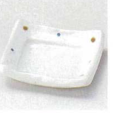
98-34-357 二色水玉角小皿 600円 7×6.8×1.7cm 30114352