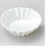
98-42-757 白大ベキング珍味 360円 6.3×1.7cm 09842757