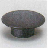
98-5-277 いぶし高台小皿 1,230円 8.2×3cm 11906271