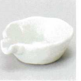
98-21-677 アイボリー片口小付 820円 8×7×2.5cm 12215673