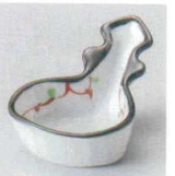
98-7-527 赤絵唐草びわ型珍味 1,750円 9×6.3×4.5cm 12201525