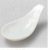
98-51-187 白珍味トレー(大) 680円 11×5.3×2cm 09851187 98-52-187 白珍味トレー(小) 270円 9×4.5×1.7cm 09852187