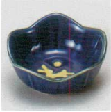
98-24-697 青釉兎花型珍味(有田焼) 800円 7.5×3.5cm 10×16入 11128691