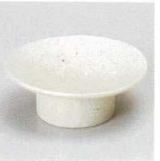
98-6-277 粉引高台小皿 1,230円 8.2×3cm 29217273