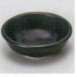
98-40-277 黒結晶タキ珍味 350円 8.6×8.6×2.9cm 11838274