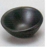
98-27-207 黒マットM型珍味 630円 6.5×3.4cm 12433203