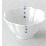
98-8-717 プチドット花型珍味 1,100円 7.3×3.7cm 12205715