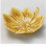
98-38-717 黄瀬戸紅葉珍味 400円 8.5×7.5×2.3cm 09838717