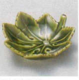
98-39-717 織部紅葉珍味 400円 8.5×7.5×2.3cm 09839717