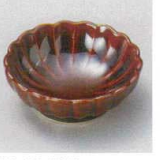
98-41-717 飴菊型珍味 370円 6.4×2.3cm 09841717