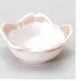
98-35-757 桜珍味 600円 7.5×7×3cm 11937754