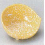
98-12-527 黄白吹かまくら珍味 1,150円 7.2×7×4.2cm 11110526