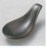
98-49-187 黒マット片手珍味(大) 680円 11×5.3×2cm 09849187 98-50-187 黒マット片手珍味(小) 540円 9×4.5×1.7cm 09850187