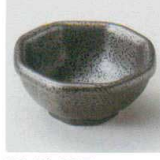
98-36-287 黒鉄吹き八角珍味 500円 6×5.8×2.6cm 120入 12507285