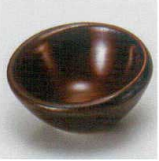
98-25-207 アメ釉M型珍味 630円 6.5×3.4cm 12923202