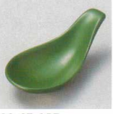
98-47-187 グリーンマット片手珍味(大) 680円 11×5.3×2cm 09847187 98-48-187 グリーンマット片手珍味(小) 540円 9×4.5×1.7cm 09848187