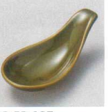
98-53-187 織部片手珍味(大) 680円 11×5.3×2cm 09853187 98-54-187 織部片手珍味(小) 540円 9×4.5×1.7cm 09854187