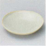
98-18-207 シルバーグリーン豆皿 850円 7.3×1.3cm 11132206