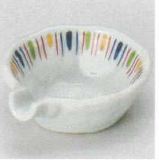
98-19-697 潤十草 片口小付 800円 8.5×7.2×2.9cm 10×24入 11419693