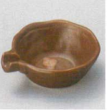
98-20-677 銀彩茶片口姫小付 820円 8×7×2.9cm 09820677