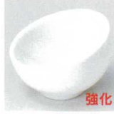
98-29-717 ホワイト丸スラント珍味 550円 6.3×6.3×4.3cm 54207714