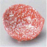
98-11-527 赤白吹かまくら珍味 1,150円 7.2×7×4.2cm 11109526