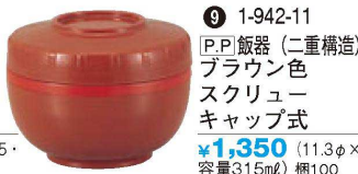
⑨ 1-942-11 [P.P.]飯器(二重構造) ブラウン色 スクリュウキャップ式 ¥1,350 (11.3φ×8.5・容量315ml) 梱100