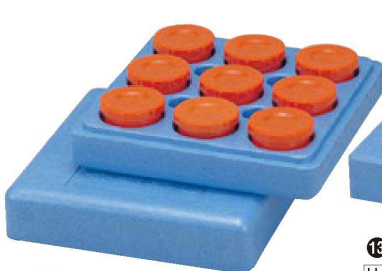
⑫ 1-112-1 [H.P.]茶碗蒸しハッポウ 9ヶ入 ¥3,500 (外寸36×36×13.5・本体穴内寸9φ×4.7・蓋穴内寸10φ×4.6)