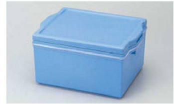
③ 1-943-3 エスレンコンテナ SP-20-D深型 直送 ¥14,300 (48.3×37.3×25.6H)

※①～④につきましては10個単位のご注文での販売となります。 ⑤につきましては20個単位のご注文での販売となります。