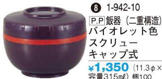
⑧ 1-942-10 [P.P.]飯器(二重構造) バイオレット色 スクリュウキャップ式 ¥1,350 (11.3φ×8.5・容量315ml) 梱100