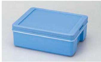
① 1-943-1 コンテナ SP-10-D 直送 ¥13,000 (48×37.3×17.9H) 材質:本体・フタ:P.P.+断熱材 主な用途:ごはん(2升入)、寿司しゃり、弁当箱(10個)、豆腐(2号パック20個)

ポリスチレン樹脂・ポリエチレン樹脂・ポリプロピレン樹脂は食器などに多く使われている樹脂で食品衛生上全く問題はありません。エスレンコンテナは機能性を追求したシンプルデザイン商品です。