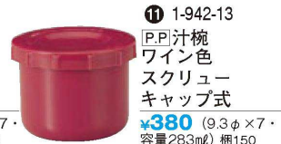
⑪ 1-942-13 [P.P.]汁椀 ワイン色 スクリュウキャップ式 ¥380 (9.3φ×7・容量283ml) 梱150