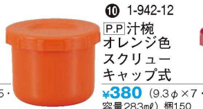
⑩ 1-942-12 [P.P.]汁椀 オレンジ色 スクリュウキャップ式 ¥380 (9.3φ×7・容量283ml) 梱150