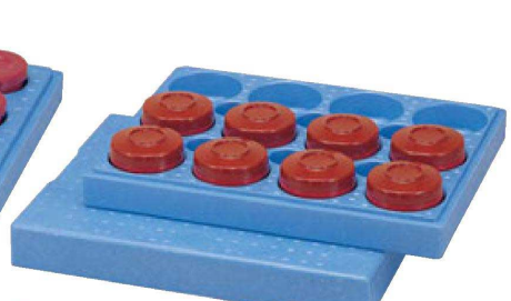
⑭ 1-113-1 [H.P.]飯器保温用ハッポウ 12ヶ入 ¥6,000 (外寸55.5×42×12・本体穴内寸11.5φ×4.7・蓋穴内寸12.5φ×4.7)