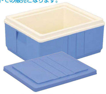
⑦ HC-40 蓋付き(容量22ℓ) 直送 1-942-8 ¥30,900 (外寸48×39×23.9・内寸39.7×32×19) 梱4 材質:P.P.+断熱材