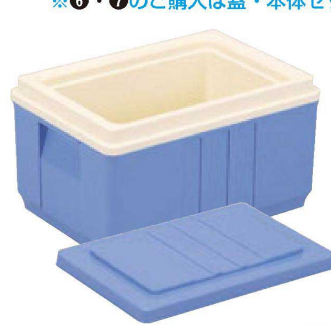
⑥ HC-20 蓋付き(容量11ℓ) 直送 1-942-7 ¥28,200 (外寸42×28×23.9・内寸32×21×19) 梱4 材質:P.P.+断熱材