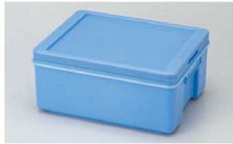
② 1-943-2 エスレンコンテナ SP-15-D 直送 ¥13,500 (48.3×37.3×21.8H) 材質:本体・フタ:P.P.+断熱材 主な用途:ごはん(3升入)、寿司しゃり等