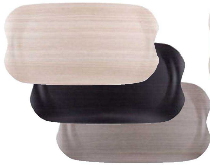
① 困アーストレイ 小