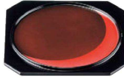
⑨ 困日の出盆 紅月 本漆塗 B-9-85 ¥26,500 (19.8×19.8×1)