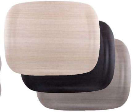
③ 困アーストレイ 大