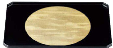
⑯ 困隅切長手布目膳 日月銀彩裏黒千筋 本漆塗 B-9-92 ¥33,000 (42.5×29.7×1.7)