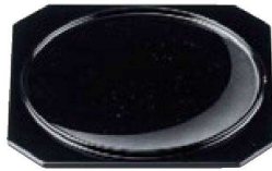
⑧ 困日の出盆 淡月 本漆塗 B-9-84 ¥26,500 (19.8×19.8×1)