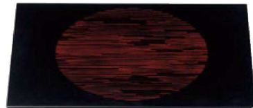
⑮ 困乱筋日月彫敷膳 溜日輪裏黒乾漆塗 本漆塗 B-9-91 ¥29,500 (42.4×30×1)