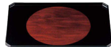
⑰ 困隅切長手布目膳 日月白檀裏黒千筋 本漆塗 B-9-93 ¥34,000 (42.5×29.7×1.7)