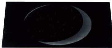
⑪ 困長手敷膳 淡月 本漆塗 B-9-87 ¥36,000 (42.4×30×1)