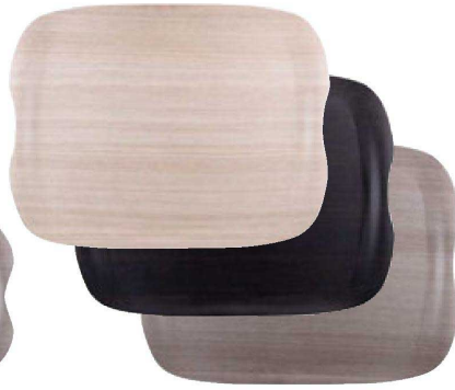
② 困アーストレイ 中