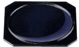
⑩ 困日の出盆 蒼月 本漆塗 B-9-86 ¥26,500 (19.8×19.8×1)