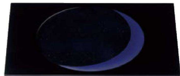
⑬ 困長手敷膳 蒼月 本漆塗 B-9-89 ¥36,000 (42.4×30×1)