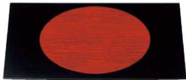
⑭ 困乱筋日月彫敷膳 日輪裏黒乾漆塗 本漆塗 B-9-90 ¥29,500 (42.4×30×1)