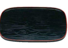
㉑ 困尺2寸小判木目盆 黒天朱 1-128-17 ¥7,200 (36×25.8×1.6) 櫃30