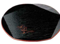
⑪ 困尺0寸五角木目盆 黒測朱松葉 B-12-94 ¥6,000 (29.5φ×1.5) 櫃30