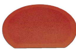
② 困半月敷膳 ワイン石目 測乾漆 1-124-2 尺2寸 ¥7,000 (35.5×31.4×0.7) 櫃30 1-124-3 尺3寸 ¥8,200 (39.1×34.7×0.7) 櫃20