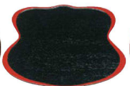
⑳ 困尺3寸ひさご盆 黒天朱 1-128-19 ¥6,800 (38.6×36.5×1) 櫃20