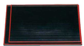
⑬ 困切立千筋盆 黒天朱 1-128-14 尺2寸 ¥5,000 (36.3×27.2×1) 櫃30 1-128-15 尺3寸 ¥5,400 (39.3×28.8×1) 櫃20