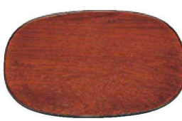
⑲ 困尺3寸ラグビー盆 木目 1-128-20 ¥8,800 (39×31.8×1) 櫃20