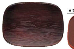
㉒ 困尺2寸くつわ盆 溜木目 1-127-17 ¥8,000 (34.8×34.8×1) 櫃30