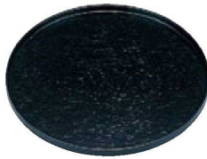
⑩ 困尺0寸丸盆 黒 1-130-22 ¥5,800 (30.5φ×1.8) 櫃30