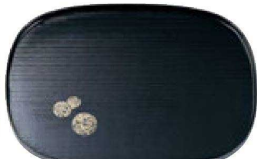
⑮ 困尺3寸小判盆 手まり B-5-71 ¥9,100 (40.4×29.3×1.9) 櫃20