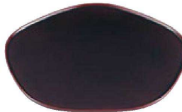
⑰ 困尺3寸梅型盆 真溜塗 B-7-51 ¥15,800 (39×34×1.2) 櫃20