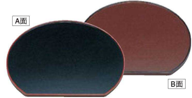
④ 困半月両面盆 黒乾漆天朱/茶乾漆天黒 1-127-8 尺2寸 ¥8,500 (35.8×32.1×1.3) 櫃30 1-127-9 尺3寸 ¥8,800 (39×34.5×1.5) 櫃20