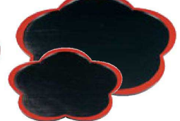
⑱ 困梅型皿 黒天朱 B-7-49 尺0寸 ¥7,600 (29.7×27.2×0.8) 櫃30 B-7-50 尺2.5寸 ¥8,800 (37.8×35.4×1) 櫃20