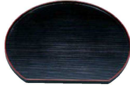
③ 困切立半月盆 黒千筋天朱 1-127-1 尺1寸 ¥6,800 (33.2×29×1.5) 櫃30 1-127-2 尺2寸 ¥7,200 (36×32×1.6) 櫃30 1-127-3 尺3寸 ¥7,450 (39.5×35×1.6) 櫃20