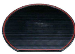
⑥ 困尺2寸半月千筋盆 黒天朱 1-127-12 ¥7,000 (35.8×32.1×1.5) 櫃30