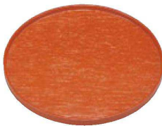
⑨ 困9寸丸盆 朱 1-130-21 ¥5,300 (27.1φ×1.5) 櫃30