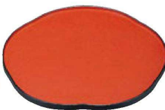
⑯ 困尺2寸梅型盆 朱乾漆 1-125-1 ¥13,800 (37.6×34.8×1.9) 櫃30