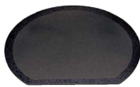
① 困半月敷膳 黒乾漆渋石目 1-124-4 尺2寸 ¥7,000 (35.5×31.4×0.7) 櫃30 1-124-5 尺3寸 ¥8,200 (39.1×34.7×0.7) 櫃20