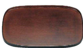
⑭ 困尺2寸小判盆 根来布目 1-128-18 ¥9,200 (36×25.8×1.5) 櫃30