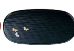
⑫ 困尺0寸小判盆 蝶 B-5-70 ¥6,800 (29.7×16.2×1.2) 櫃30