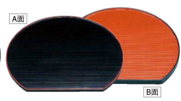
⑧ 困半月千筋両面盆 黒天朱/朱天黒 1-127-5 尺2寸 ¥7,000 (34.2×30×1.5) 櫃30 1-127-6 尺3寸 ¥7,950 (39.4×35×1.5) 櫃20 1-127-7 尺4寸 ¥8,800 (42.6×38×1.5) 櫃20