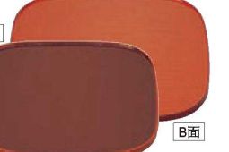
㉓ 困くつわ両面盆 溜布目/朱布目 1-127-18 ¥11,000 (36.3×36.3×1.2) 櫃30