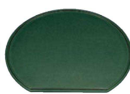
⑦ 困尺3寸半月足付膳 グリーン乾漆 1-127-14 ¥14,000 (39.5×36×2) 櫃20