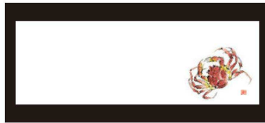
⑤ 箸置マット (100枚単位) B-20-47 上質紙 ズワイガニ (12月~2月) 限定品 ¥950 (1枚 ¥9.5) (38×13)