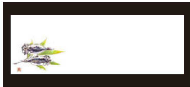
⑦ 箸置マット (100枚単位) 限定品 B-20-73 上質紙 干物 (オールシーズン) 限定品 ¥950 (1枚 ¥9.5) (38×13)