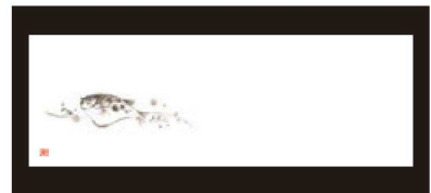
⑪ 箸置マット (100枚単位) B-27-50 上質紙 河豚 (11月~2月) 限定品 ¥950 (1枚 ¥9.5) (38×13)