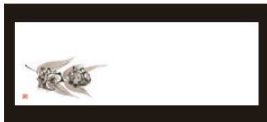
⑨ 箸置マット (100枚単位) 限定品 B-27-49 上質紙 サザエ (5月~8月) 限定品 ¥950 (1枚 ¥9.5) (38×13)