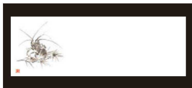
⑮ 箸置マット (100枚単位) 限定品 B-27-55 上質紙 海老・2 (オールシーズン) 限定品 ¥950 (1枚 ¥9.5) (38×13)