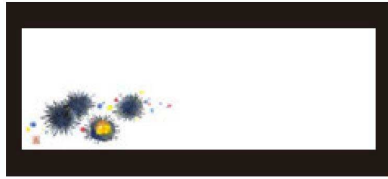
① 箸置マット (100枚単位) B-20-72 上質紙 ウニ (5月~8月) ¥950 (1枚 ¥9.5) (38×13)