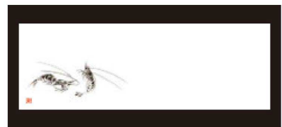
⑭ 箸置マット (100枚単位) B-27-51 上質紙 海老・1 (オールシーズン) 限定品 ¥950 (1枚 ¥9.5) (38×13)