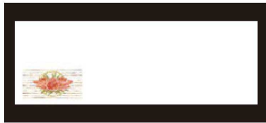
④ 箸置マット (100枚単位) B-20-74 上質紙 カニ (12月~2月) 限定品 ¥950 (1枚 ¥9.5) (38×13)