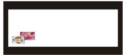
⑥ 箸置マット (100枚単位) B-20-77 上質紙 ひらめ (12月~3月) 限定品 ¥950 (1枚 ¥9.5) (38×13)