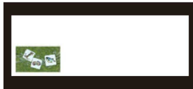
⑧ 箸置マット (100枚単位) 限定品 B-20-75 上質紙 海鮮 (オールシーズン) 限定品 ¥950 (1枚 ¥9.5) (38×13)