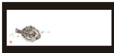
⑬ 箸置マット (100枚単位) 限定品 B-27-52 上質紙 新ひらめ (12月~3月) 限定品 ¥950 (1枚 ¥9.5) (38×13)