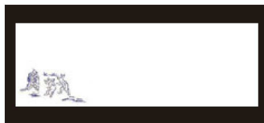
⑯ 箸置マット (100枚単位) B-20-43 上質紙 鳥獣戯画 ¥950 (1枚 ¥9.5) (38×13)