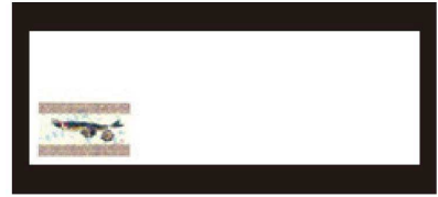
③ 箸置マット (100枚単位) B-20-76 上質紙 鮎 (6月~8月) 限定品 ¥950 (1枚 ¥9.5) (38×13)