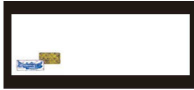
② 箸置マット (100枚単位) B-20-78 上質紙 鰯 (5月~7月) 限定品 ¥950 (1枚 ¥9.5) (38×13)