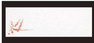
② 箸置マット (100枚単位) B-27-73 雲流入 梅 (2月~4月) ¥1,700 (1枚 ¥17) (38×13)