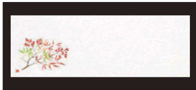
① 箸置マット (100枚単位) B-27-70 雲流入 実南天 (1月~2月) ¥1,700 (1枚 ¥17) (38×13)