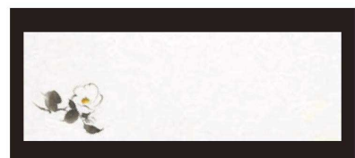
⑱ 箸置マット (100枚単位) B-27-87 雲流入 白椿 (11月~12月) ¥1,700 (1枚 ¥17) (38×13)