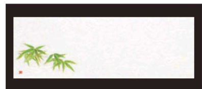
⑨ 箸置マット (100枚単位) B-27-78 雲流入 笹 (6月~8月) 限定品 ¥1,700 (1枚 ¥17) (38×13)