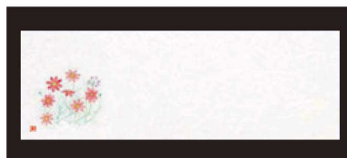
⑪ 箸置マット (100枚単位) B-27-80 雲流入 秋桜 (8月~9月) ¥1,700 (1枚 ¥17) (38×13)