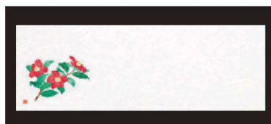
⑰ 箸置マット (100枚単位) B-27-86 雲流入 赤椿 (11月~12月) ¥1,700 (1枚 ¥17) (38×13)