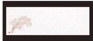
③ 箸置マット (100枚単位) B-27-71 雲流入 桜・1 (3月~4月) ¥1,700 (1枚 ¥17) (38×13)