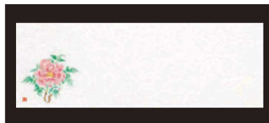
⑤ 箸置マット (100枚単位) B-27-74 雲流入 牡丹 (4月~5月) ¥1,700 (1枚 ¥17) (38×13)