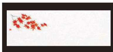
⑭ 箸置マット (100枚単位) B-27-83 雲流入 紅葉・1 (9月~10月) ¥1,700 (1枚 ¥17) (38×13)