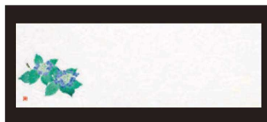
⑧ 箸置マット (100枚単位) B-27-77 雲流入 紫陽花 (5月~6月) ¥1,700 (1枚 ¥17) (38×13)