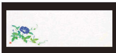
⑩ 箸置マット (100枚単位) B-27-79 雲流入 朝顔 (7月~8月) ¥1,700 (1枚 ¥17) (38×13)