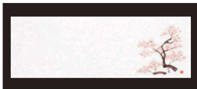
④ 箸置マット (100枚単位) B-27-72 雲流入 桜・2 (3月~4月) 限定品 ¥1,700 (1枚 ¥17) (38×13)