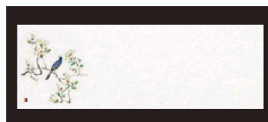
⑭ 箸置マット (100枚単位) B-28-2 雲流入 花鳥・2 [限定品] ¥1,700 (1枚 ¥17) (38×13)