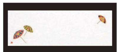
⑥ 箸置マット (100枚単位) B-27-93 雲流入 傘文 [限定品] ¥1,700 (1枚 ¥17) (38×13)