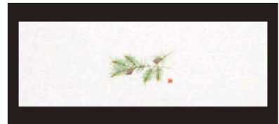
④ 箸置マット (100枚単位) B-27-91 雲流入 松・2 (オールシーズン) [限定品] ¥1,700 (1枚 ¥17) (38×13)