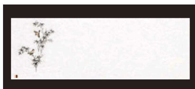
⑬ 箸置マット (100枚単位) B-28-1 雲流入 花鳥・1 [限定品] ¥1,700 (1枚 ¥17) (38×13)