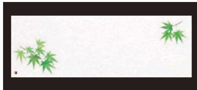
② 箸置マット (100枚単位) B-27-89 雲流入 青もみじ (オールシーズン) ¥1,700 (1枚 ¥17) (38×13)