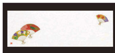
⑤ 箸置マット (100枚単位) B-27-92 雲流入 扇文 ¥1,700 (1枚 ¥17) (38×13)