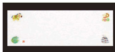
⑪ 箸置マット (100枚単位) B-27-98 雲流入 千支・2 [限定品] ¥1,700 (1枚 ¥17) (38×13)