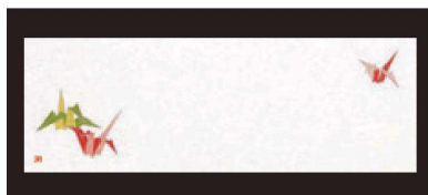
⑦ 箸置マット (100枚単位) B-27-94 雲流入 折り鶴 ¥1,700 (1枚 ¥17) (38×13)