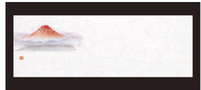
① 箸置マット (100枚単位) B-27-56 雲流入 紅富士 (オールシーズン) ¥1,700 (1枚 ¥17) (38×13)