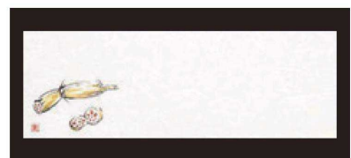
⑨ 箸置マット (100枚単位) B-21-16 雲流入 蓮根 (9月~2月) 限定品 ¥1,700 (1枚 ¥17) (38×13)