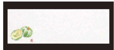
⑥ 箸置マット (100枚単位) B-21-12 雲流入 南瓜 (7月~9月) 限定品 ¥1,700 (1枚 ¥17) (38×13)