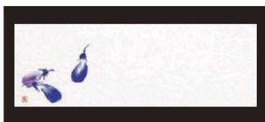
⑦ 箸置マット (100枚単位) B-21-13 雲流入 茄子 (7月~9月) 限定品 ¥1,700 (1枚 ¥17) (38×13)