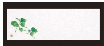
③ 箸置マット (100枚単位) B-21-10 雲流入 大葉 (6月~10月) 限定品 ¥1,700 (1枚 ¥17) (38×13)