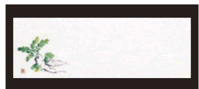
⑫ 箸置マット (100枚単位) B-21-18 雲流入 大根 (12月~2月) 限定品 ¥1,700 (1枚 ¥17) (38×13)