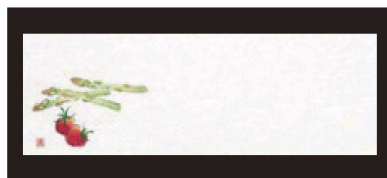
② 箸置マット (100枚単位) B-21-11 雲流入 アスパラ (4月~6月) 限定品 ¥1,700 (1枚 ¥17) (38×13)