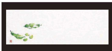
① 箸置マット (100枚単位) B-21-9 雲流入 さやえんどう (4月~6月) 限定品 ¥1,700 (1枚 ¥17) (38×13)