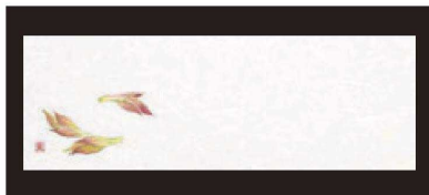
④ 箸置マット (100枚単位) B-21-14 雲流入 みょうが (6月~8月) 限定品 ¥1,700 (1枚 ¥17) (38×13)