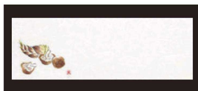
⑧ 箸置マット (100枚単位) B-21-7 雲流入 椎茸 (9月~11月) 限定品 ¥1,700 (1枚 ¥17) (38×13)