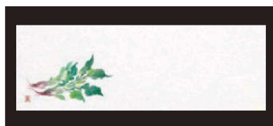
⑪ 箸置マット (100枚単位) B-21-8 雲流入 ほうれん草 (11月~2月) 限定品 ¥1,700 (1枚 ¥17) (38×13)