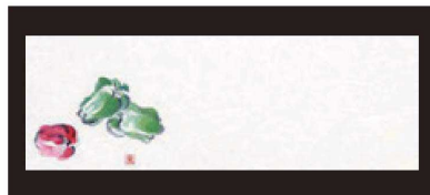
⑤ 箸置マット (100枚単位) B-21-15 雲流入 ピーマン (6月~9月) 限定品 ¥1,700 (1枚 ¥17) (38×13)