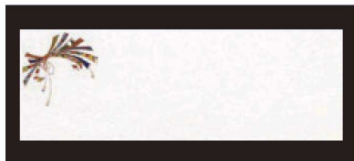
② 箸置マット (100枚単位) B-20-92 雲流入 のし紋 ¥1,700 (1枚 ¥17) (38×13)