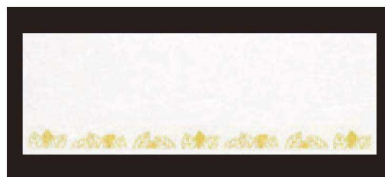
⑥ 箸置マット (100枚単位) B-20-96 雲流入 木の葉紋 限定品 ¥1,700 (1枚 ¥17) (38×13)