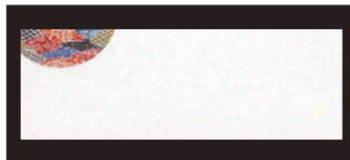
③ 箸置マット (100枚単位) B-20-93 雲流入 紅型・1 ¥1,700 (1枚 ¥17) (38×13)