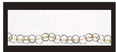
⑩ 箸置マット (100枚単位) B-21-1 雲流入 刷毛目・輪 限定品 ¥1,700 (1枚 ¥17) (38×13)