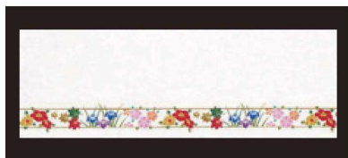
⑤ 箸置マット (100枚単位) B-20-95 雲流入 花帯 ¥1,700 (1枚 ¥17) (38×13)