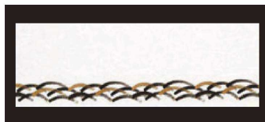
⑨ 箸置マット (100枚単位) B-20-99 雲流入 刷毛目・波 限定品 ¥1,700 (1枚 ¥17) (38×13)