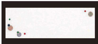
① 箸置マット (100枚単位) B-20-91 雲流入 まり紋 限定品 ¥1,700 (1枚 ¥17) (38×13)