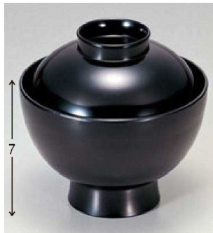
⑤ 1-156-4 TM 小丸椀 黒 ¥2,300 (10.4φ×10) 椀100 210cc 128g