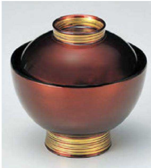
③ W-11-65 TA 小丸椀 白檀筋目 ¥2,500 (10.4φ×10) 椀100 210cc 104g