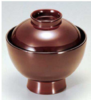
⑥ 1-156-5 TM 小丸椀 溜 ¥2,400 (10.4φ×10) 椀100 210cc 128g