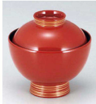
④ W-12-70 TA 小丸椀 朱筋目 ¥2,200 (10.4φ×10) 椀100 210cc 104g