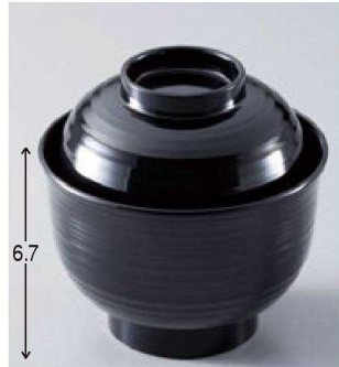
⑫ W-20-97 TA 3.3寸筋入羽反椀 黒 ¥1,800 (10φ×10) 椀100 220cc 100g