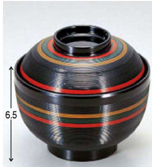
⑨ 1-163-1 TA 玉子千筋椀 ロクロ目 ¥1,650 (10.2φ×9) 椀100 220cc 110g