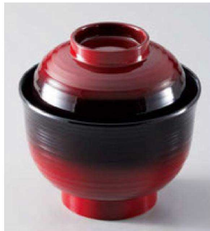
⑬ W-20-98 TA 3.3寸筋入羽反椀 朱ぼかし ¥2,050 (10φ×10) 椀100 220cc 100g