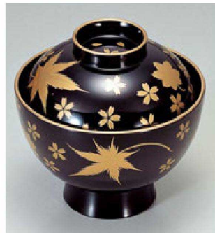
⑧ 1-157-16 TA 小丸椀 黒春秋 S・H塗 ¥5,250 (10.4φ×10) 椀100 210cc 128g