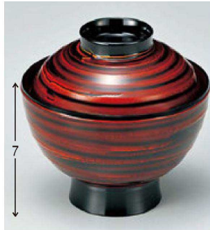
① W-11-67 TA 小丸椀 春慶ヘラハケ目内朱 ¥2,100 (10.4φ×10) 椀100 210cc 104g