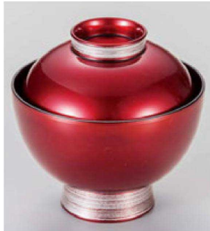
② W-19-75 TA 小丸椀 ワイン筋目 ¥2,500 (10.4φ×10) 椀100 210cc 104g