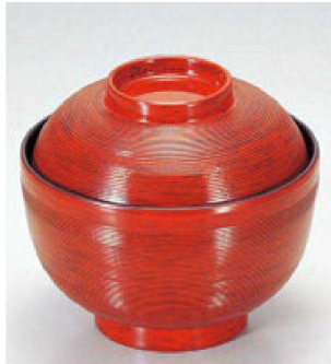
⑩ 1-163-2 TA 玉子千筋椀 後藤塗 ¥1,550 (10.2φ×9) 椀100 220cc 110g