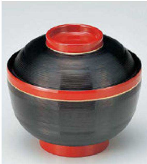
⑪ W-11-76 TA 玉子千筋椀 黒刷毛目金線 ¥1,800 (10.2φ×9) 椀100 230cc 110g