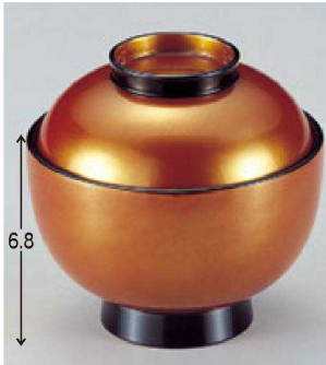
⑮ W-5-7 TA 3.5寸丸吸椀 紅金内朱つば黒 S・H塗 ¥3,150 (10.1φ×9.7) 椀100 270cc 103g