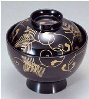
⑦ 1-157-11 TM 小丸椀 黒松唐草 S・H塗 ¥4,800 (10.4φ×10) 椀100 210cc 128g