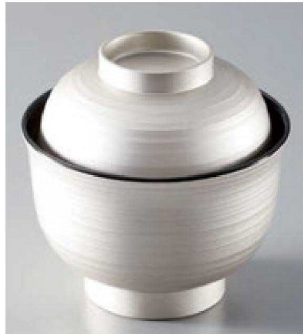
⑭ W-20-99 TA 3.3寸筋入羽反椀 銀溜 ¥2,600 (10φ×10) 椀100 220cc 100g