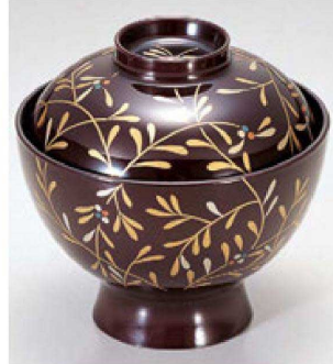
⑫ 1-161-10 TM 花小吸椀 溜南天 S・H塗 ¥5,050 (10.3φ×10.1) 楕100 220cc 127g