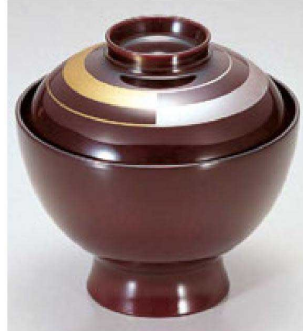
⑪ 1-161-7 TM 花小吸椀 溜金銀帯市松 ¥3,750 (10.3φ×10.1) 楕100 220cc 127g