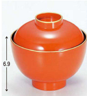
① W-1-59 TA 3.4寸小町吸椀 朱天金 ¥1,400 (10.3φ×9.8) 楕100 240cc 90g