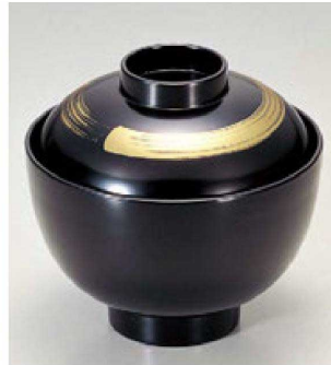
④ 1-161-11 TA 3.4寸小町吸椀 黒一筆 S・H塗 ¥2,050 (10.3φ×9.8) 楕100 240cc 90g