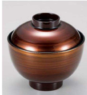
⑦ W-17-11 TA 3.4寸小町吸椀 茶金刷毛目 ¥2,850 (10.3φ×9.8) 楕100 240cc 90g