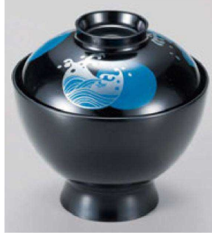
⑭ W-18-62 TM 花小吸椀 黒波 ¥3,800 (10.3φ×10.1) 楕100 220cc