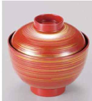
⑤ W-18-71 TA 3.4寸小町吸椀 朱金刷毛目 ¥2,800 (10.3φ×9.8) 楕100 240cc 90g