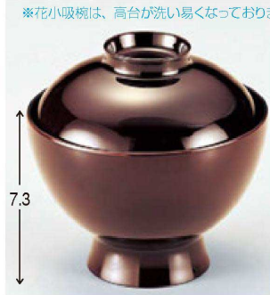
⑨ W-4-63 TM 花小吸椀 溜 ¥2,500 (10.3φ×10.1) 楕100 220cc 127g