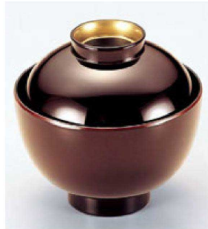
③ W-4-64 TA 3.4寸小町吸椀 溜つば金 ¥1,850 (10.3φ×9.8) 楕100 240cc 90g