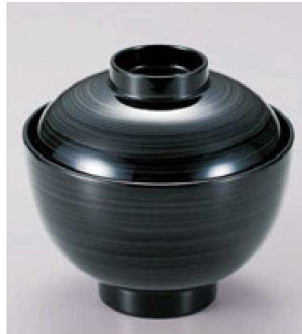
② W-17-10 TA 3.4寸小町吸椀 黒木目 ¥1,600 (10.3φ×9.8) 楕100 240cc 90g