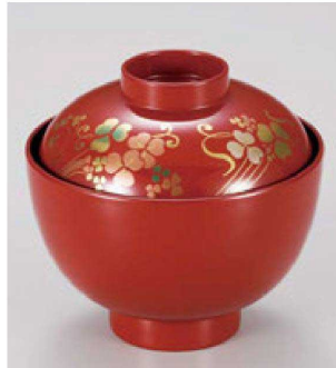
⑥ W-17-74 TA 3.4寸小町吸椀 朱クローバー ¥2,850 (10.3φ×9.8) 楕100 240cc 90g