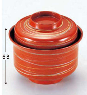
⑮ W-4-46 TA 京若椀 朱あやひも ¥1,850 (10.4φ×11.2) 楕100 250cc 105g