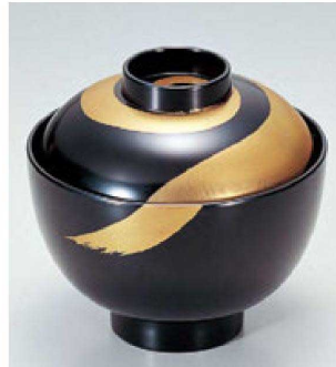
⑧ 1-161-15 TA 3.4寸小町吸椀 黒月光 ¥3,300 (10.3φ×9.8) 楕100 260cc 90g