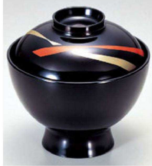
⑬ 1-161-5 TM 花小吸椀 黒花帯 ¥3,250 (10.3φ×10.1) 楕100 220cc