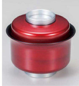
⑯ W-19-77 TA 京若椀 ワイン測銀 ¥3,000 (10.4φ×11.2) 楕100 260cc 105g