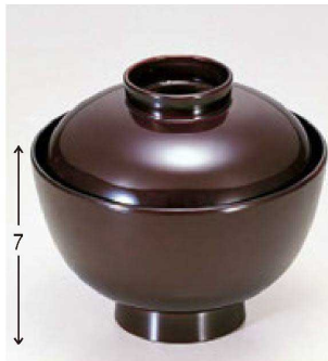
① 1-166-1 TA 越前椀 溜