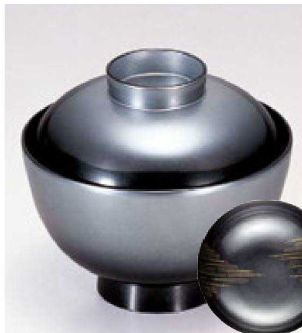
② TA 越前椀 黒かすみ

1-166-2 ¥2,700 (11.1φ×9.9) 楕100 240cc 133g