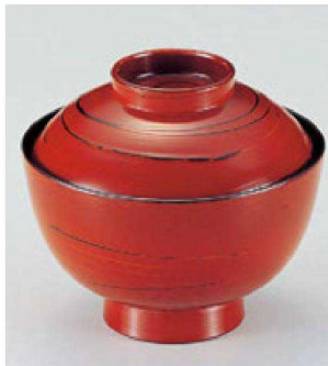
⑥ W-5-1 TA 新越前椀 渦根来 ¥3,300 (11.1φ×9.7) 楕100 290cc 127g