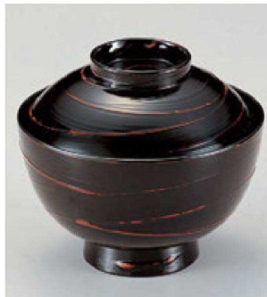
⑦ W-5-2 TA 新越前椀 渦曙 ¥3,250 (11.1φ×9.7) 楕100 290cc 127g