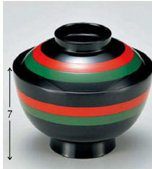
⑨ W-11-83 TA 新越前椀 二色ライン ¥2,050 (11.1φ×9.7) 楕100 290cc 127g