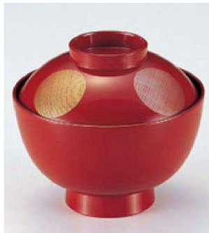
③ W-4-98 TA 新越前椀 朱日月 S・H塗 ¥2,800 (11.1φ×9.7) 楕100 290cc 127g