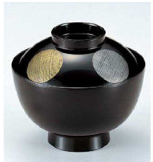
④ W-4-99 TA 新越前椀 黒日月 S・H塗 ¥2,800 (11.1φ×9.7) 楕100 290cc 127g