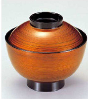
⑭ 1-168-4 TA 新越前椀 茶金刷毛目 S・H塗 ¥3,100 (11.1φ×9.7) 楕100 290cc 127g