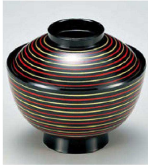
⑮ W-11-95 TA 新越前椀 朱金ライン引 ¥3,300 (11.1φ×9.7) 楕100 290cc 127g