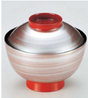
⑩ W-11-92 TA 新越前椀 朱かすみつば朱 ¥2,800 (11.1φ×9.7) 楕100 290cc 127g