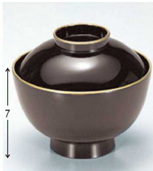
① W-2-11 TA 新越前椀 マロン天金 ¥1,500 (11.1φ×9.7) 楕100 290cc 127g