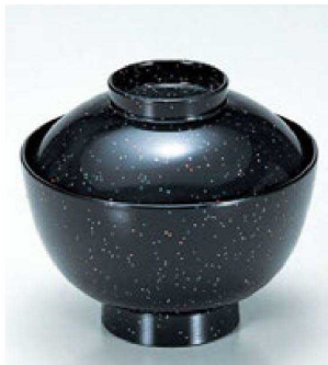
② W-2-12 TA 新越前椀 青貝 ¥1,900 (11.1φ×9.7) 楕100 290cc 127g