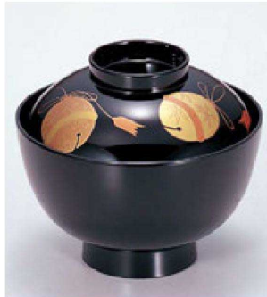
⑪ W-1-33 TA 新越前椀 黒鈴 ¥2,800 (11.1φ×9.7) 楕100 290cc 127g