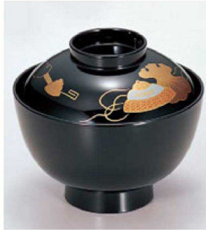
⑬ W-1-35 TA 新越前椀 黒七宝 ¥3,000 (11.1φ×9.7) 楕100 290cc 127g