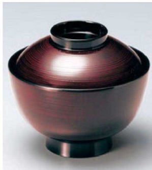
⑤ W-9-87 TA 新越前椀 溜刷毛目 ¥2,300 (11.1φ×9.7) 楕100 290cc 127g