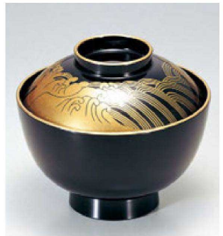
⑧ 1-168-6 TA 新越前椀 黒金波 S・H塗 ¥3,450 (11.1φ×9.7) 楕100 290cc 127g