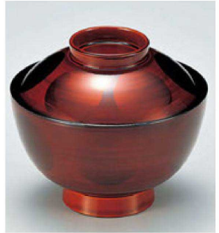
⑯ W-11-96 TA 新越前椀 漆調白檀日月 S・H塗 ¥4,800 (11.1φ×9.7) 楕100 290cc 127g