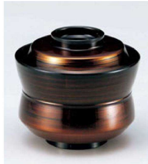
⑦ W-10-33 TM 3.2寸杵型椀 茶金つむぎ S・H 塗 ¥3,800 (9.4φ×8.5) 椀100 250cc 120g