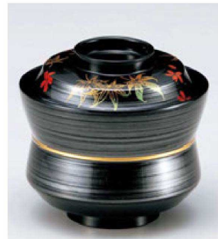
⑫ W-10-38 TM 3.5寸杵型椀 銀刷毛目春秋 S・H 塗 ¥4,700 (10.3φ×9.2) 椀100 330cc 144g