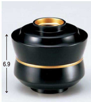
① W-9-71 TM 3.2寸杵型椀 黒つば金ライン ¥2,650 (9.4φ×8.5) 椀100 250cc 120g