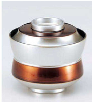
⑤ W-10-31 TM 3.2寸杵型椀 銀透き帯茶 ¥3,600 (9.4φ×8.5) 椀100 250cc 120g