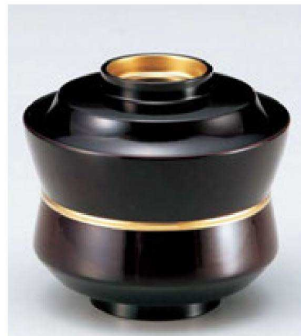
⑪ W-10-35 TM 3.5寸杵型椀 溜つば金ライン ¥3,200 (10.3φ×9.2) 椀100 330cc 144g