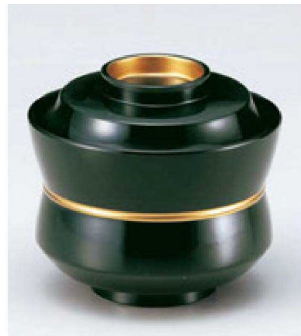
③ W-9-73 TM 3.2寸杵型椀 緑つば金ライン ¥2,650 (9.4φ×8.5) 椀100 250cc 120g