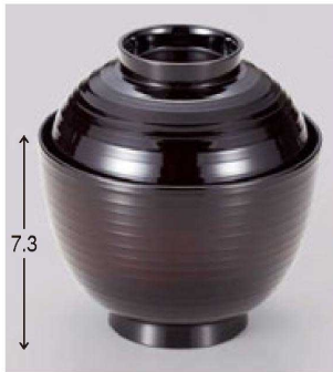
⑭ W-18-82 TM 3.5寸乱引椀溜 ¥2,550 (10φ×10.7) 椀100 290cc 127g