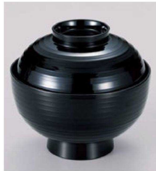
⑯ W-18-84 TM 4寸乱引椀 黒P.T塗 ¥3,400 (11.6φ×10.6) 椀100 310cc 180g