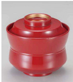
② W-20-49 TM 3.2寸杵型小吸椀 総赤つば金 ¥3,100 (9.4φ×8.5) 椀100 250cc 120g