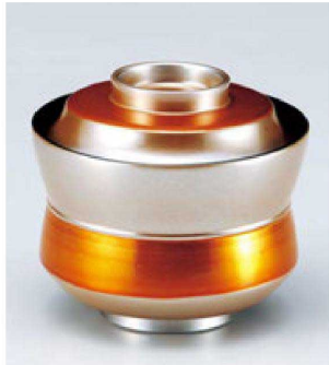
⑥ W-10-32 TM 3.2寸杵型椀 銀透き帯金 ¥3,600 (9.4φ×8.5) 椀100 250cc 120g