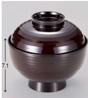
⑮ W-18-83 TM 4寸乱引椀溜 ¥2,700 (11.6φ×10.6) 椀100 310cc 180g