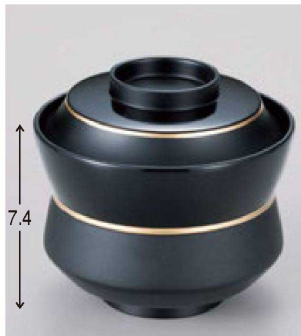
⑨ W-18-81 TM 3.5寸杵型椀 黒消塗分金線 ¥3,000 (10.3φ×9.2) 椀100 330cc 144g