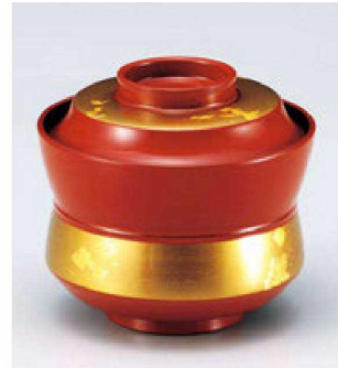
⑧ W-10-34 TM 3.2寸杵型椀 赤に金箔帯 S・H 塗 ¥4,100 (9.4φ×8.5) 椀100 250cc 120g