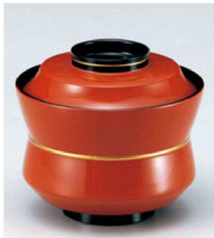
⑩ W-9-77 TM 3.5寸杵型椀 朱金ライン ¥3,200 (10.3φ×9.2) 椀100 330cc 144g