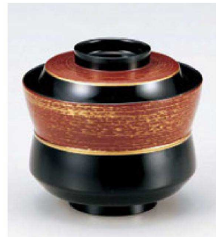
④ W-9-74 TM 3.2寸杵型椀 黒に朱金かすり ¥3,000 (9.4φ×8.5) 椀100 250cc 120g