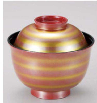
⑧ W-17-16 TM 3.6寸百合小吸椀 紅金ライン ¥4,500 (10.8φ×9.8) 楕100 260cc 131g