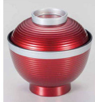
④ W-19-84 TA 3.6寸高千筋吸椀 ワイン帯銀 ¥2,900 (10.7φ×9.7) 楕100 280cc 107g