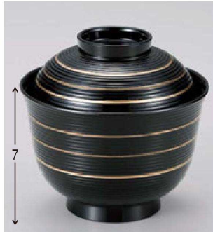
⑤ W-17-13 TM 3.6寸平筋小吸椀 黒ライン ¥2,900 (10.3φ×10) 楕100 260cc 112g