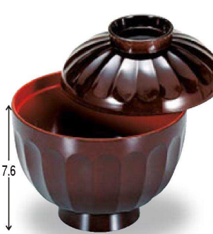
⑩ W-2-14 TM 3.6寸菊形吸椀 溜内朱 ¥3,000 (10.6φ×10.4) 楕100 320cc 133g