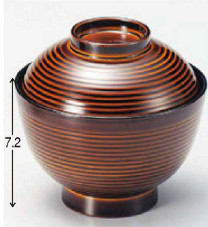
① W-12-79 TA 3.6寸高千筋吸椀 漆調朱合春慶 ¥2,400 (10.7φ×9.7) 楕100 280cc 107g