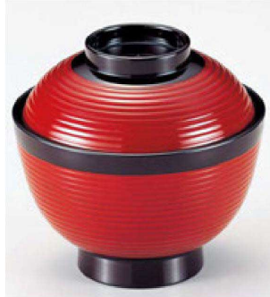
② W-5-70 TA 3.6寸高千筋吸椀 紅帯黒 ¥1,800 (10.7φ×9.7) 楕100 280cc 107g