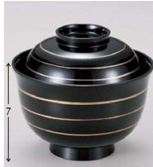
⑦ W-17-15 TM 3.6寸百合小吸椀 黒ライン ¥2,900 (10.8φ×9.8) 楕100 260cc 131g