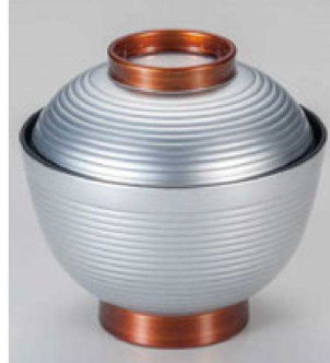
③ W-19-83 TA 3.6寸高千筋吸椀 銀つば白檀 ¥2,600 (10.7φ×9.7) 楕100 280cc 107g