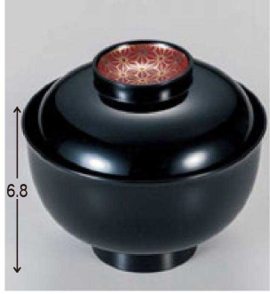
⑬ W-19-85 TM 3.7寸羽反吸椀 黒 朱麻の葉 ¥3,450 (11φ×9.6) 楕100 260cc 147g