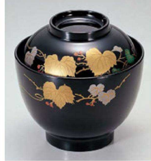
⑫ 1-163-15 TM 耐熱玉子吸椀 黒ツタ ¥5,050 (10.2φ×9.9) 楕100 240cc 148g