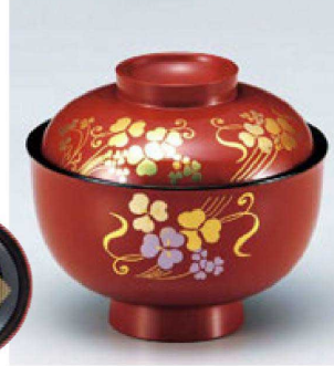
⑮ W-10-46 TM 3.7寸羽反吸椀 朱にクローバー ¥3,600 (11φ×9.6) 楕100 260cc 147g