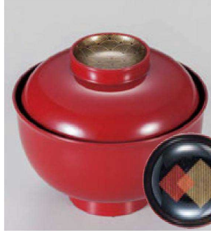
⑭ W-19-86 TM 3.7寸羽反吸椀 朱 金波見返し色紙 ¥4,050 (11φ×9.6) 楕100 260cc 147g