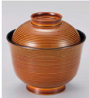
⑥ W-17-14 TM 3.6寸平筋小吸椀 漆調春慶塗 ¥3,500 (10.3φ×10) 楕100 260cc 112g