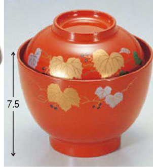
⑪ 1-163-14 TM 耐熱玉子吸椀 朱ツタ内朱 ¥5,050 (10.2φ×9.9) 楕100 240cc 148g