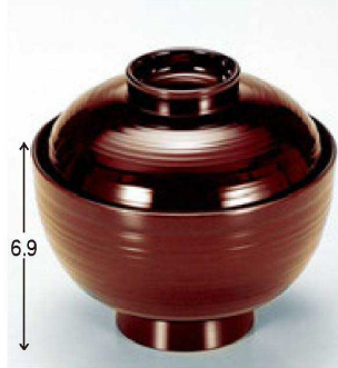
⑨ W-2-17 TM 3.6寸乱引椀 溜 ¥2,500 (10.8φ×9.8) 楕100 260cc 136g