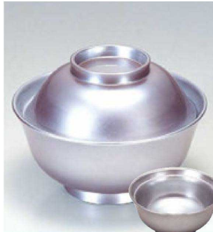
② 1-175-3 TM 4寸羽反吸椀 光銀内銀 ¥4,300 (11.9φ×8.5) 楕100 230cc 143g