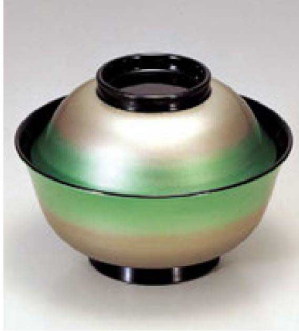
⑮ 1-175-16 TM 4寸羽反吸椀 緑銀ぼかし S・H塗 ¥4,950 (11.9φ×8.5) 楕100 230cc 143g