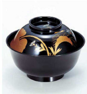
⑧ W-1-45 TM 4寸羽反吸椀 黒つわぶき ¥3,700 (11.9φ×8.5) 楕100 230cc 143g