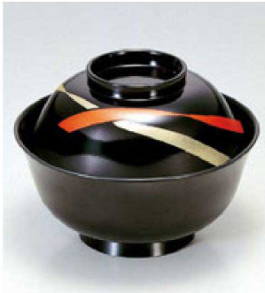
⑦ 1-175-9 TM 4寸羽反吸椀 黒花帯 ¥3,900 (11.9φ×8.5) 楕100 230cc 143g