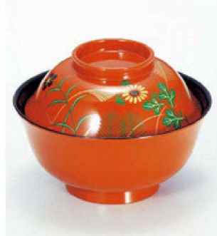
⑫ W-1-46 TM 4寸羽反吸椀 朱内黒秋草 ¥4,200 (11.9φ×8.5) 楕100 230cc 143g