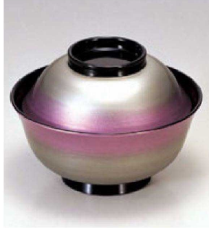
⑭ 1-175-15 TM 4寸羽反吸椀 紫銀ぼかし S・H塗 ¥4,950 (11.9φ×8.5) 楕100 230cc 143g