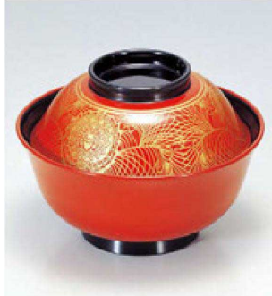
⑩ 1-175-11 TM 4寸羽反吸椀 朱金蘭 S・H塗 ¥4,500 (11.9φ×8.5) 楕100 230cc 143g