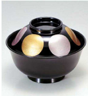
⑥ 1-175-8 TM 4寸羽反吸椀 黒金雅日月 S・H塗 ¥4,000 (11.9φ×8.5) 楕100 230cc 143g