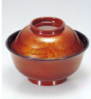
⑨ 1-175-10 TM 4寸羽反吸椀 白壇唐草 S・H塗 ¥4,350 (11.9φ×8.5) 楕100 230cc 143g