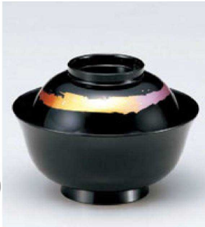
③ W-10-90 TM 4寸羽反吸椀 雅銀河 S・H塗 ¥4,300 (11.9φ×8.5) 楕100 230cc 143g