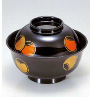
⑯ 1-175-14 TM 4寸羽反吸椀 鈴 ¥4,500 (11.9φ×8.5) 楕100 230cc 143g