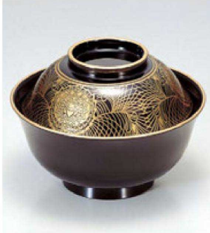
⑪ 1-175-12 TM 4寸羽反吸椀 黒金蘭 S・H塗 ¥4,500 (11.9φ×8.5) 楕100 230cc 143g