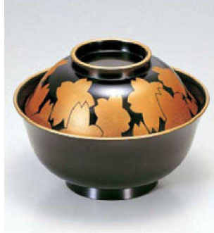
⑬ 1-175-13 TM 4寸羽反吸椀 黒金桜 ¥4,600 (11.9φ×8.5) 楕100 230cc 143g