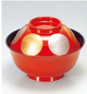
⑤ 1-175-7 TM 4寸羽反吸椀 朱金雅日月 S・H塗 ¥4,000 (11.9φ×8.5) 楕100 230cc 143g