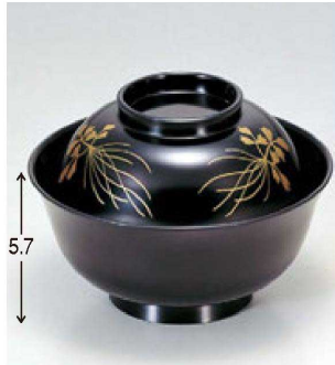
① 1-175-6 TM 4寸羽反吸椀 黒セリ ¥3,850 (11.9φ×8.5) 楕100 230cc 143g