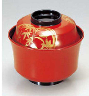
⑯ 1-165-10 TM 3.5寸京型吸椀 朱花丸四君子 S・H塗 ¥4,500 (10.7φ×9.7) 椀100 290cc 153g