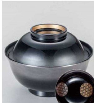
⑥ W-19-48 TA ニュー羽反吸椀 黒銀ぼかし 見返し付 ¥4,150 (11.7φ×8.5) 椀100 230cc 113g