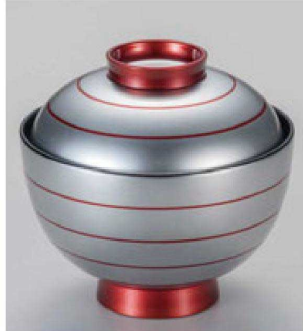
⑩ W-20-42 TM 3.6寸隅丸椀 銀ワインレッドライン ¥4,200 (10.8φ×9.9) 椀100 260cc 134g