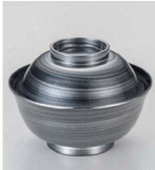
⑤ W-19-47 TA ニュー羽反吸椀 銀渦刷毛目 ¥3,700 (11.7φ×8.5) 椀100 230cc 113g