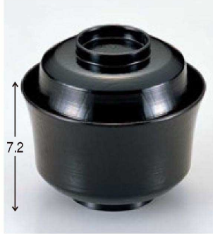
⑬ W-4-47 TM 3.6寸羽反千筋吸椀 黒 ¥2,300 (11φ×10) 椀100 290cc 155g