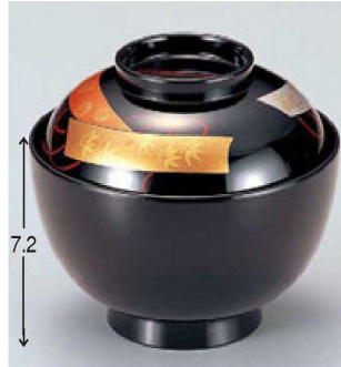
⑫ W-4-90 TM 3.7寸玉子椀 黒に短冊 ¥3,600 (11.2φ×10.2) 椀100 310cc 154g