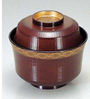
⑭ 1-165-6 TM 3.6寸羽反千筋吸椀 溜青海波 ¥3,600 (11φ×10) 椀100 290cc 155g