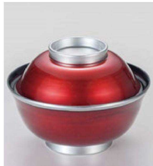
④ W-19-46 TA ニュー羽反吸椀 ワイン帯銀 ¥3,250 (11.7φ×8.5) 椀100 230cc 113g