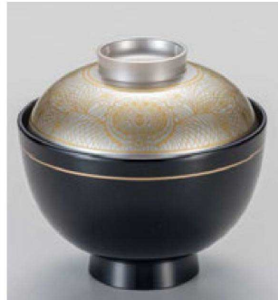
⑧ W-20-40 TM 3.4寸隅丸椀 銀透き蘭 ¥4,100 (10.3φ×9.7) 椀100 240cc 122g