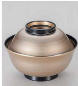
③ W-19-45 TA ニュー羽反吸椀 金銀刷毛目つば金 ¥3,100 (11.7φ×8.5) 椀100 230cc 113g