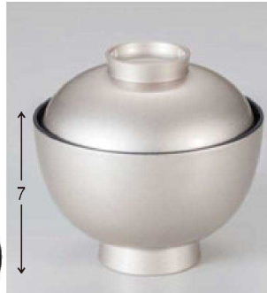
⑦ W-20-39 TM 3.4寸隅丸椀 銀溜 ¥2,700 (10.3φ×9.7) 椀100 240cc 122g