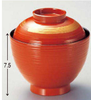
⑪ 1-163-5 TM あらたま椀 朱一筆 ¥2,950 (10.1φ×10.1) 椀100 250cc 192g