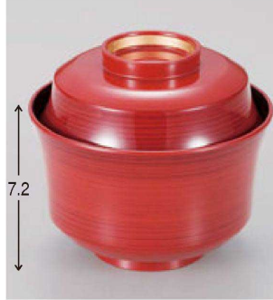
⑮ W-18-68 TM 3.5寸京型吸椀 赤茶刷毛目つば金 ¥3,300 (10.7φ×9.7) 椀100 290cc 153g