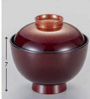
⑨ W-20-41 TM 3.6寸隅丸椀 溜／梨地ぼかし ¥3,200 (10.8φ×9.9) 椀100 260cc 134g