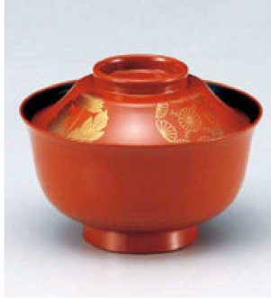
⑭ W-10-83 TM 富士羽反椀 朱に菊 S・H塗 ¥4,850 (11.9φ×8.8) 楕100 300cc 140g