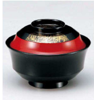
⑧ W-10-78 TM 4寸天竜寺椀 市松葉 S・H塗 ¥4,000 (12φ×8.8) 楕100 280cc 145g