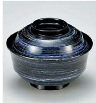
④ W-12-6 TM 4寸天竜寺椀 紫カスリ ¥3,250 (12φ×8.8) 楕100 280cc 145g