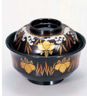
⑪ W-1-48 TM 4寸天竜寺椀 溜波芦桐 ¥5,000 (12φ×8.8) 楕100 280cc 145g