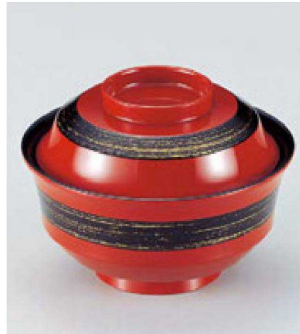
③ W-5-32 TM 4寸天竜寺椀 赤に金かすり ¥3,000 (12φ×8.8) 楕100 280cc 145g