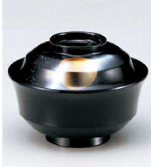
⑩ W-10-79 TM 4寸天竜寺椀 金月光 S・H塗 ¥5,200 (12φ×8.8) 楕100 280cc 145g