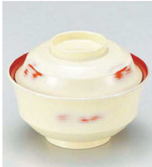
⑥ W-12-5 TM 4寸天竜寺椀 アイボリー-朱研ざ出し内朱 ¥3,350 (12φ×8.8) 楕100 280cc 145g