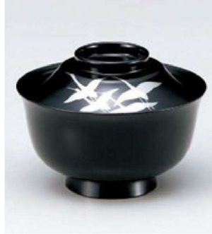
⑮ W-10-84 TM 富士羽反椀 黒群れ鶴 S・H塗 ¥5,100 (11.9φ×8.8) 楕100 300cc 140g