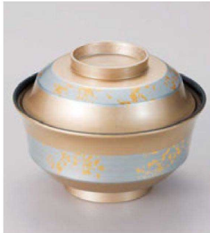
② W-18-73 TM 4寸天竜寺椀 シャンパン銀帯金箔 ¥5,150 (12φ×8.8) 楕100 280cc 145g