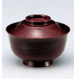
⑯ W-10-85 TM 富士羽反椀 古代朱刷毛目 S・H塗 ¥5,200 (11.9φ×8.8) 楕100 300cc 140g