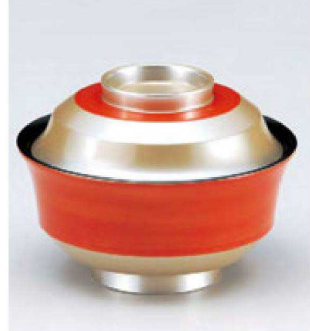
⑫ W-10-80 TM 4寸天竜寺椀 赤帯銀地 ¥6,450 (12φ×8.8) 楕100 280cc 145g