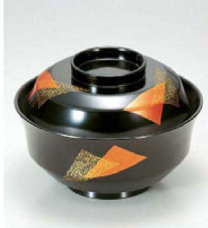
⑨ 1-187-14-A TM 4寸天竜寺椀 黒モダン ¥4,600 (12φ×8.8) 楕100 280cc 145g