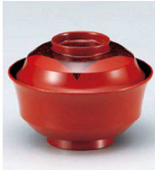
⑤ W-10-76 TM 4寸天竜寺椀 朱布張 S・H塗 ¥3,300 (12φ×8.8) 楕100 280cc 145g