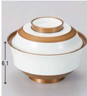
① W-18-72 TM 4寸天竜寺椀 白金独楽 ¥4,700 (12φ×8.8) 楕100 280cc 145g