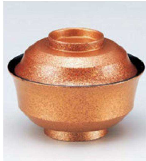
⑦ W-10-77 TM 4寸天竜寺椀 錆たたき ¥3,850 (12φ×8.8) 楕100 280cc 145g