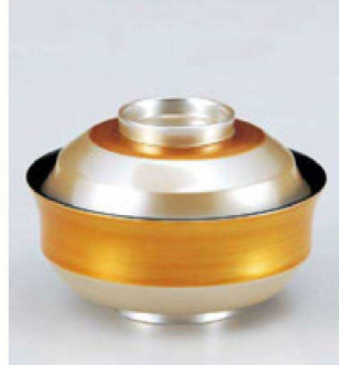
⑯ W-10-99 TM 4.2寸天竜寺椀 透き帯銀地 ¥5,100 (12.6φ×9) 楕100 320cc 160g