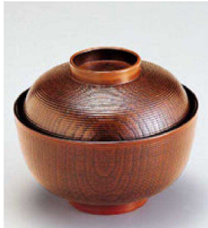
② W-2-18 TA 4寸千筋ケヤキ吸椀 栃 ¥1,600 (11.8φ×9.8) 楕100 320cc 127g