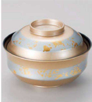
⑮ W-18-74 TM 4.2寸天竜寺椀 シャンパン銀帯金箔 ¥5,000 (12.6φ×9) 楕100 320cc 160g