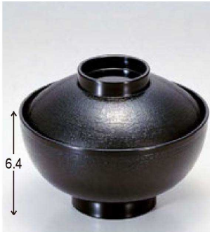
③ 1-181-3 TA 4寸布目吸椀 黒 ¥1,250 (12φ×9.2) 楕100 300cc 119g