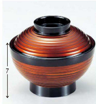
⑧ W-5-78 TA 4.2寸平筋椀 茶金帯内朱 ¥2,100 (12.7φ×10.7) 楕100 330cc