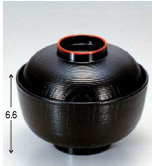
① 1-181-12 TA 4寸千筋ケヤキ吸椀 黒天朱 ¥1,300 (11.8φ×9.8) 楕100 320cc 127g