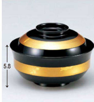
⑬ W-10-96 TM 4.2寸天竜寺椀 黒金箔帯 S・H塗 ¥4,500 (12.6φ×9) 楕100 320cc 160g