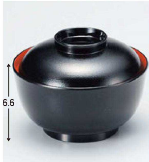
⑤ W-13-4 TA 4寸姫椀 黒刷毛目内朱 ¥2,100 (12.6φ×9.4) 楕100 370cc 172g