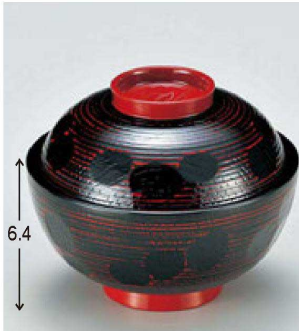
⑦ W-12-9 TM のみ彫仙才椀 溜研ぎ出し ¥3,050 (12.1φ×9.8) 楕100 300cc 177g