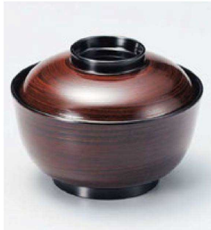
⑥ W-13-5 TA 4寸姫椀 茶刷毛目 ¥2,700 (12.6φ×9.4) 楕100 370cc 172g