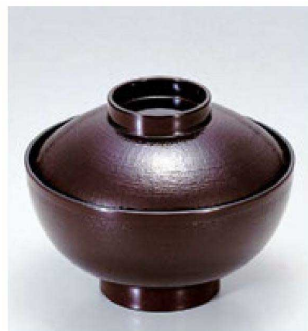
④ 1-181-4 TA 4寸布目吸椀 溜 ¥1,400 (12φ×9.2) 楕100 300cc 119g