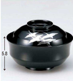
⑪ W-10-94 TM 4.2寸天竜寺椀 黒群れ鶴 S・H塗 ¥4,300 (12.6φ×9) 楕100 320cc 179g