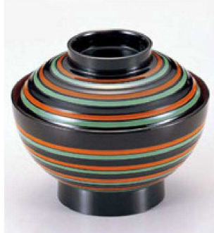
⑨ W-8-22 TA 4.2寸平筋椀 二色ライン内朱 ¥2,200 (12.7φ×10.7) 楕100 330cc 179g