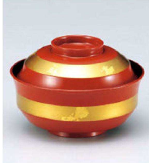
⑭ W-10-97 TM 4.2寸天竜寺椀 赤金箔帯 S・H塗 ¥4,500 (12.6φ×9) 楕100 320cc 160g