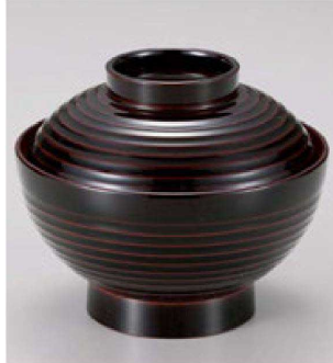
⑩ W-17-12 TA 4.2寸平筋椀 漆溜内朱 ¥2,500 (12.7φ×10.7) 楕100 330cc 179g