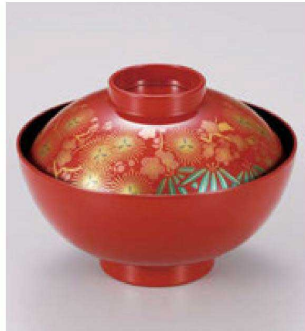
⑤ W-17-73 TA 4寸平仙才椀 朱松竹梅 ¥3,150 (12.5φ×8.7) 欄100 250cc 139g