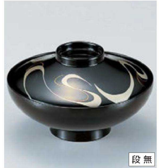
⑯ W-5-42 TM 4.5寸平富士椀 黒銀流水 S・H塗 ¥5,800 (13.5φ×8) 欄100 350cc 156g