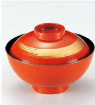
② W-5-23 TA 4寸平仙才椀 朱一筆 ¥2,000 (12.5φ×8.7) 欄100 260cc 139g