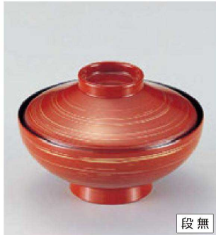
⑨ W-5-37 TM 4寸平富士椀 朱金銀かすみ ¥3,350 (12φ×8.1) 欄100 290cc 133g