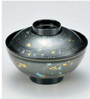
③ W-11-97 TA 4寸平仙才椀 銀箔ちらし ¥2,550 (12.5φ×8.7) 欄100 260cc 139g