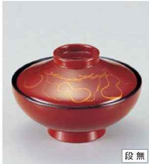
⑩ W-5-38 TM 4寸平富士椀 白壇ひさご S・H塗 ¥4,300 (12φ×8.1) 欄100 290cc 133g