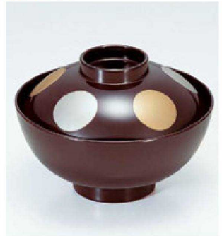
④ 1-173-4 TA 4寸平仙才椀 溜日月 ¥2,850 (12.5φ×8.7) 欄100 260cc 139g