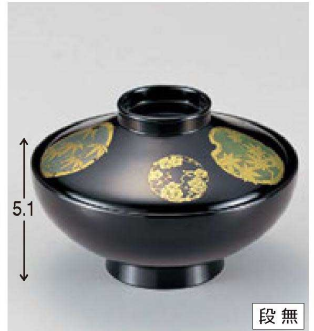
⑧ W-5-39 TM 4寸平富士椀 黒花丸 ¥3,750 (12φ×8.1) 欄100 290cc 133g