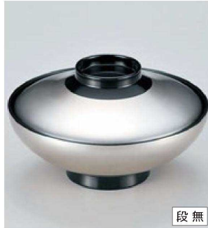
⑮ W-12-7 TM 4.5寸平富士椀 銀溜 ¥5,400 (13.5φ×8) 欄100 350cc 156g