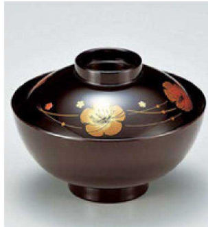
⑦ W-11-99 TA 4寸平仙才椀 溜に四季 ¥3,300 (12.5φ×8.7) 欄100 260cc 139g