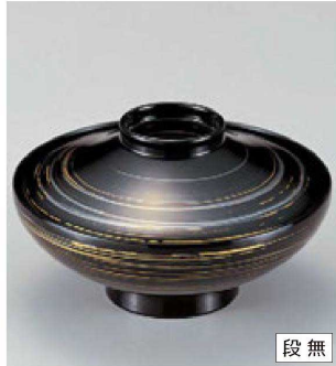
⑬ W-5-40 TM 4.5寸平富士椀 黒金銀かすみ ¥4,300 (13.5φ×8) 欄100 350cc 156g