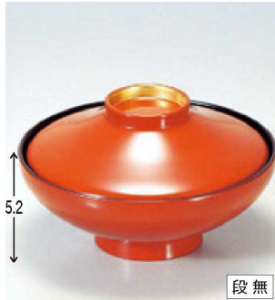
⑪ 1-203-3 TM 4.5寸平富士椀 朱つば金 ¥3,500 (13.5φ×8) 欄100 350cc 156g