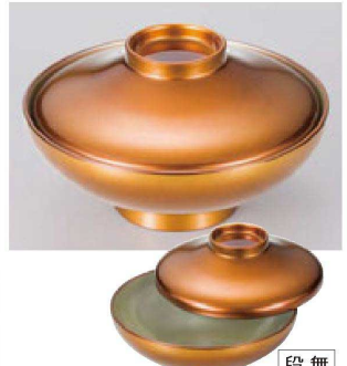
⑫ W-18-75 TM 4.5寸平富士椀 銅内銀 ¥5,000 (13.5φ×8) 欄100 350cc 156g