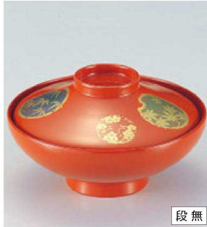
⑭ W-5-41 TM 4.5寸平富士椀 総洗朱花丸 ¥4,600 (13.5φ×8) 欄100 350cc 156g