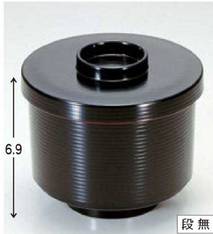
⑤ 1-179-1 TA 千筋小吸椀 黒内朱 ¥1,000 (9φ×7.9) 椀100 260cc 80g