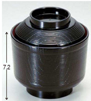
⑮ 1-179-15 A 千筋櫛小吸椀 黒内朱 ¥1,000 (9φ×9.5) 椀100 230cc 81g