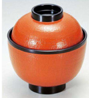
⑩ 1-179-6 A 3.2寸布目小吸椀 朱帯ツバ黒 ¥750 (9.5φ×10) 椀200 220cc 97g