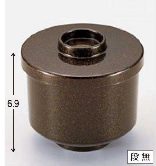
⑫ W-2-1 A 切立小吸椀 梨地内朱 ¥900 (7.9φ×8) 椀200 240cc 72g