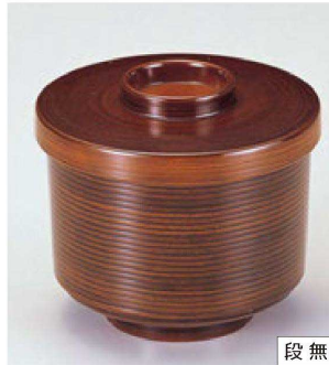
⑦ W-5-9 TA 千筋小吸椀 栃 ¥1,200 (9φ×7.9) 椀100 260cc 80g