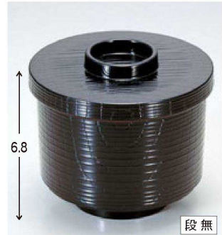
⑧ 1-179-4 A ヘギ目小吸椀 黒内朱 ¥1,000 (9φ×7.8) 椀100 250cc 86g