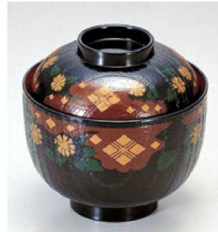
④ 1-178-19 A 桐木目小吸椀 黒に正方寺 ¥1,550 (9.5φ×9.5) 椀200 200cc 87g