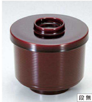
⑥ 1-179-2 TA 千筋小吸椀 溜内朱 ¥1,100 (9φ×7.9) 椀100 260cc 80g