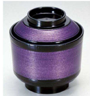
⑯ 1-179-16 A 千筋櫛小吸椀 バイオレット ¥1,500 (9φ×9.5) 椀100 230cc 81g