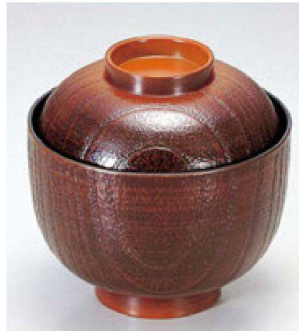
③ 1-178-18 A 桐木目小吸椀 栃 ¥950 (9.5φ×9.5) 椀200 200cc 87g