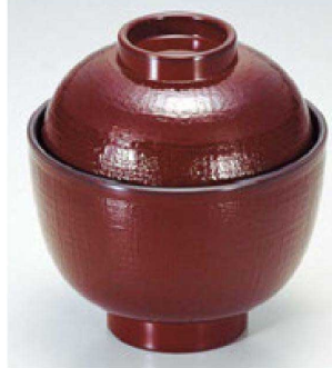
⑪ 1-179-7 A 3.2寸布目小吸椀 溜 ¥900 (9.5φ×10) 椀200 220cc 97g