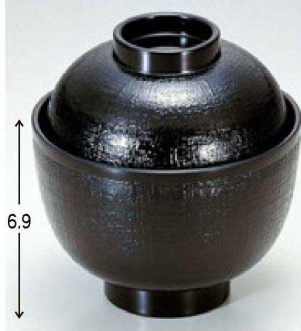
⑨ 1-179-5 A 3.2寸布目小吸椀 黒 ¥700 (9.5φ×10) 椀200 220cc 97g