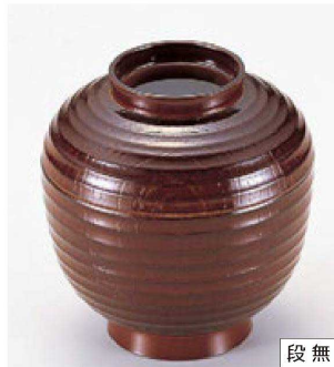
⑭ 1-178-15 A チョーチン小吸椀 溜春慶 ¥950 (9.3φ×10) 椀200 260cc 80g