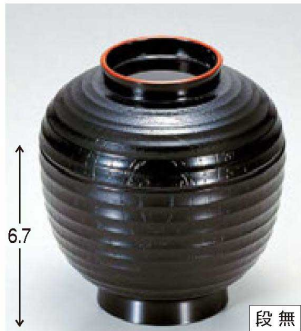
⑬ 1-178-14 A チョーチン小吸椀 黒天朱 ¥800 (9.3φ×10) 椀200 260cc 80g