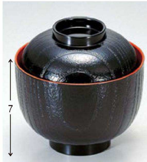
① 1-178-16 A 桐木目小吸椀 黒内朱 ¥800 (9.5φ×9.5) 椀200 200cc 87g