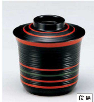
⑫ W-10-71 M 3.1寸線引小吸椀 黒朱線線引 ¥2,400 (9.4φ×9.4) 櫃100 300cc 129g