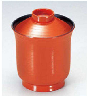
③ 1-182-4C A 箸洗い小吸椀 吉野 ¥1,450 (7.5φ×9.5) 櫃200 160cc 70g