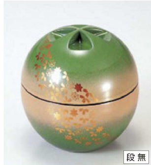
⑯ 1-176-10 A 源氏椀 グリーンばかし春秋 S・H塗 ¥3,600 (9.8φ×10.1) 櫃100 260cc 99g