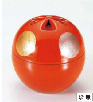
⑭ W-4-68 A 源氏椀 朱日月 S・H塗 ¥2,700 (9.8φ×10.1) 櫃100 260cc 99g