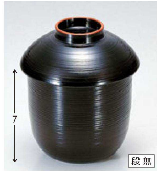
④ 1-182-6 A きのこ小吸椀 黒天朱 ¥1,700 (7.1φ×9.2) 櫃200 200cc 68g