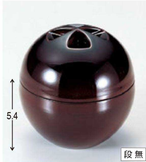
⑬ W-4-67 A 源氏椀 溜 ¥2,000 (9.8φ×10.1) 櫃100 260cc 99g