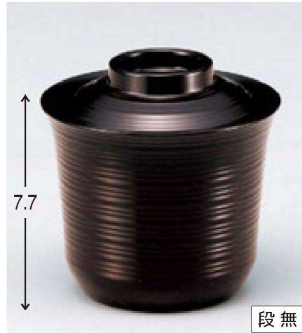
⑪ W-10-70 M 3.1寸線引小吸椀 溜 ¥2,000 (9.4φ×9.4) 櫃100 300cc 129g