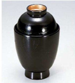
⑩ 1-182-8 A つぼね小吸椀 黒木目つば金 ¥1,500 (7.1φ×11.4) 櫃200 140cc 61g