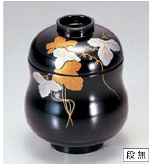
⑦ 1-155-14 M ひょうたん小吸椀 黒にツタ S・H塗 ¥4,200 (7φ×9.8) 櫃200 190cc 149g