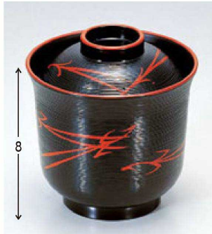
⑤ 1-182-15 A 羽反刷毛目椀 黒天朱松葉 ¥1,950 (9φ×9.4) 櫃100 230cc 84g