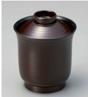
① W-21-3 A ユリ型小吸椀 新溜 ¥1,500 (7.5φ×9.5) 櫃200 160cc 70g