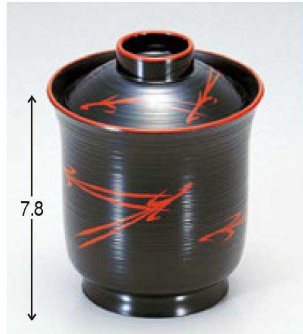
② 1-182-3 A ユリ型小吸椀 黒刷毛目松葉 ¥1,650 (7.5φ×9.5) 櫃200 160cc 70g