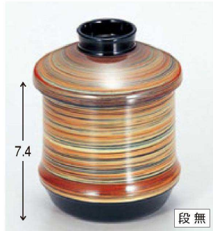
⑧ W-1-99 M 竹型小吸椀 つむぎ金線 S・H塗 ¥3,900 (7.4φ×9.5) 櫃100 200cc 94g