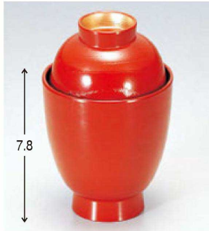
⑨ 1-182-7 A つぼね小吸椀 朱木目つば金 ¥1,500 (7.1φ×11.4) 櫃200 140cc 61g