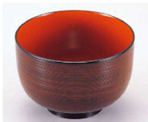
⑪ W-6-20 A 姫汁椀 溜刷毛目内朱 ¥850 (10.5φ×7) 椀200 390cc 64g