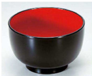
⑩ 1-188-9 A 3.6寸汁椀 黒内朱 ¥650 (10.7φ×6.7) 椀200 400cc 65g