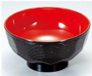
① 1-188-1 A 4寸亀甲汁椀 黒内朱 ¥250 (11.5φ×6) 椀400 320cc 52g