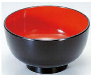
⑭ 1-188-10 A 4寸汁椀 黒内朱 ¥700 (11.7φ×6.4) 椀200 400cc 71g