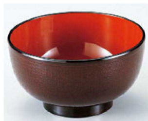
⑯ W-6-25 A 4寸雅汁椀 溜内朱 ¥800 (11.7φ×6.1) 椀300 380cc 91g