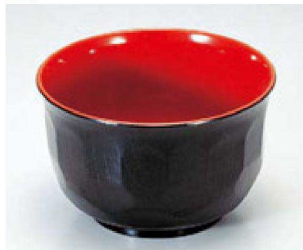
③ 1-188-3 A 3寸亀甲汁椀 黒内朱 ¥500 (9.6φ×6) 椀300 270cc 50g