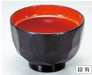
⑤ 1-188-5 A 3.2寸亀甲汁椀 黒内朱 ¥400 (9.6φ×6.8) 椀300 200cc 60g