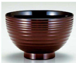
⑬ 1-188-22 A 3.8寸四季椀 うるみ千筋内黒 ¥650 (11.4φ×7.1) 椀200 400cc 88g