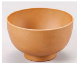
⑫ W-20-7 PET 3.5寸汁椀 ナチュラル ¥1,200 (11.3φ×6.5) 椀200 440cc 67g