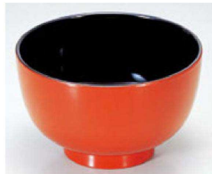
④ 1-188-4A PET 汁椀 朱内黒 ¥550 (11.2φ×6.8) 椀200 280cc 76g