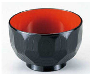
⑰ W-6-3 TA 3.6寸亀甲木目汁椀 黒内朱 ¥850 (10.9φ×7) 椀200 380cc 64g