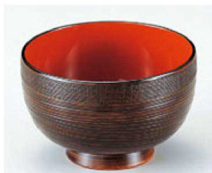
⑲ W-6-5 TA 3.6寸布目筋入汁椀 枳内朱 ¥1,050 (10.6φ×6.7) 椀200 340cc 78g