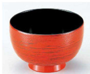
⑳ W-6-6 TA 3.6寸布目筋入汁椀 朱かすり ¥1,150 (10.6φ×6.7) 椀200 340cc 78g