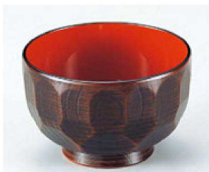
⑱ W-6-4 TA 3.6寸亀甲木目汁椀 枳内朱 ¥1,050 (10.9φ×7) 椀200 380cc 64g