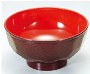
② 1-188-2 A 4寸亀甲汁椀 うるみ内朱 ¥330 (11.5φ×6) 椀400 320cc 52g