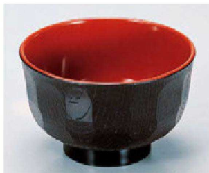
⑨ W-2-27 A 亀甲木目汁椀 黒内朱 ¥500 (10.9φ×6.7) 椀200 350cc 68g