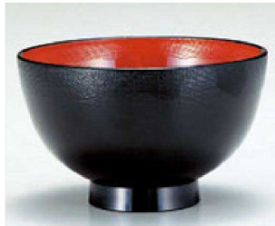
⑦ 1-188-21 A 3.8寸漉布目汁椀 黒内朱 ¥600 (11.3φ×6.9) 椀200 370cc 68g