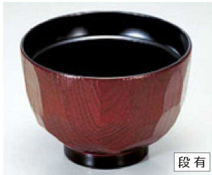
⑥ 1-188-6 A 3.2寸亀甲汁椀 溜内黒 ¥430 (9.6φ×6.8) 椀300 200cc 60g