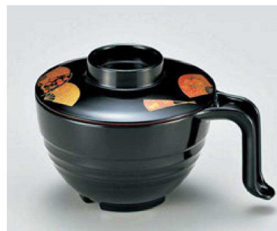
⑥ TA 手付スープ椀 黒扇面内黒塗 W-12-21 ¥3,150 (15×11.3×9.5) 椀100 440cc 142g