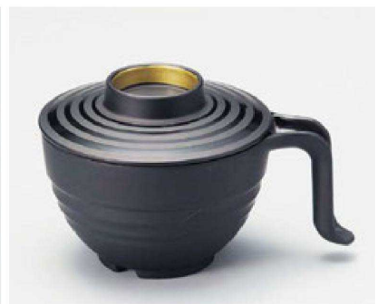
⑦ TA 手付スープ椀 黒ツヤ消ラインつば金内黒塗 W-12-95 ¥3,400 (15×11.3×9.5) 椀100 440cc 142g