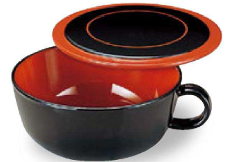
① W-8-35 TA スープ椀 黒内朱 ¥1,800 (11.7φ×5.8) 椀100 340cc 119g