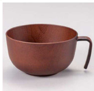
⑪ W-20-14 PET 手付スープ椀 ライトブラウン ¥1,500 (12φ×14.6×7.3) 椀200 500cc 99g