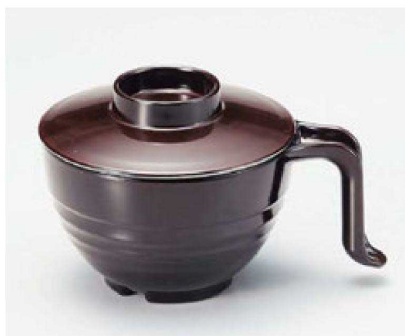
⑤ TA 手付スープ椀 消溜内銀 W-12-96 ¥3,100 (15×11.3×9.5) 椀100 440cc 142g