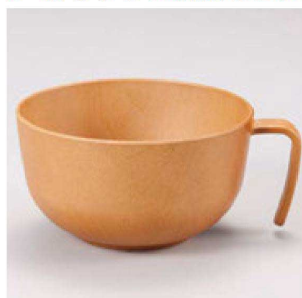
⑩ W-20-13 PET 手付スープ椀 ナチュラル ¥1,500 (12φ×14.6×7.3) 椀200 500cc 99g