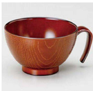
⑧ W-15-13 PET 積重手付汁椀 茶染 ¥1,400 (10.8φ×13.3×6.7) 椀200 350cc 80g