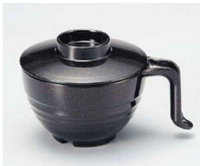
③ TA 手付スープ椀 総黒パール W-12-91 ¥2,400 (15×11.3×9.5) 椀100 440cc 142g