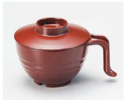
④ TA 手付スープ椀 総銀朱 W-12-92 ¥2,500 (15×11.3×9.5) 椀100 440cc 142g