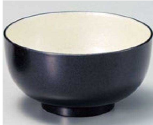
⑨ W-13-68 PET 布袋井 紫パール内アクア ¥1,900 (14.8φ×7.8) 椀100 900cc 151g