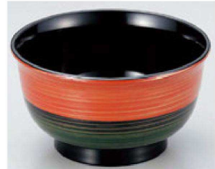
⑧ W-8-92 TA 4.5寸美里飯椀 朱緑金ライン ¥2,150 (13.4φ×7.5) 椀150 550cc 113g