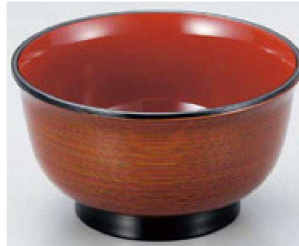
⑦ W-8-90 TA 4.5寸美里飯椀 春慶刷毛目内朱 ¥1,550 (13.4φ×7.5) 椀150 550cc 113g