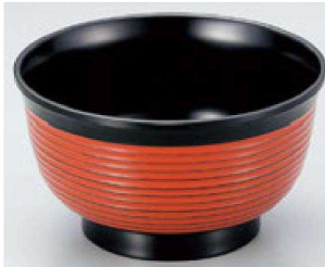
③ W-8-86 TA 4.5寸美里千筋飯椀 朱根来ライン ¥1,550 (13.4φ×7.5) 椀150 550cc 115g