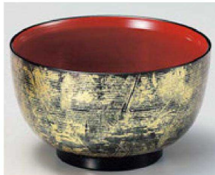
⑬ W-13-66 A 4.5寸刷毛目羽反井 黒内朱金箔 ¥2,100 (13.4φ×8) 椀100 770cc 128g