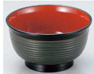
④ W-8-85 TA 4.5寸美里千筋飯椀 グリーン金ライン内朱 ¥1,450 (13.4φ×7.5) 椀150 550cc 115g