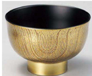
⑮ W-13-76 A 羽反木目井 金彫内消黒 ¥1,650 (13.3φ×8.7) 椀100 870cc 130g