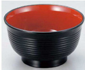
① W-8-83 TA 4.5寸美里千筋飯椀 黒内朱 ¥1,300 (13.4φ×7.5) 椀150 550cc 115g