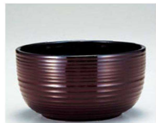
⑳ 1-546-22 A 4.7寸四季井 うるみ千筋内黒 ¥950 (14.1φ×7.2) 椀120 800cc 148g