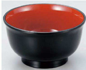
⑤ W-8-89 TA 4.5寸美里飯椀 黒内朱 ¥1,300 (13.4φ×7.5) 椀150 550cc 113g