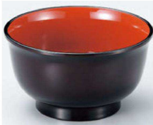
⑥ W-8-93 TA 4.5寸美里飯椀 溜内朱 ¥1,400 (13.4φ×7.5) 椀150 550cc 113g