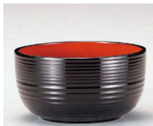
⑲ W-6-39 A 4.7寸四季井 黒千筋内朱 ¥950 (14.1φ×7.2) 椀120 800cc 148g