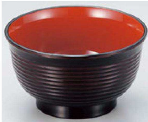
② W-8-84 TA 4.5寸美里千筋飯椀 溜内朱 ¥1,400 (13.4φ×7.5) 椀150 550cc 115g