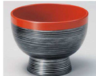
⑯ W-13-78 A 4.5寸高台お好み椀 黒銀ライン内朱 ¥2,100 (13.5φ×10.2) 椀100 700cc 197g