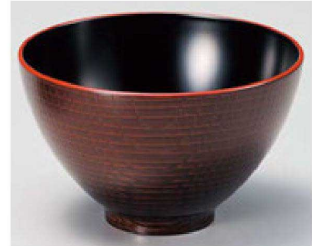
⑫ W-13-70 PET 4.7寸つぼみ木目井 溜春慶 ¥1,550 (14φ×8.7) 椀100 700cc 147g