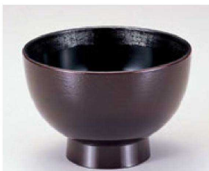
⑱ W-6-38 A 4.5寸澗布目高台井 溜 ¥1,050 (13.7φ×9.2) 椀120 660cc 166g