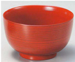
⑭ W-13-64 A 4.5寸刷毛目羽反井 朱筋目 ¥1,400 (13.4φ×8) 椀100 770cc 128g