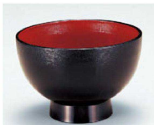
⑰ 1-546-24 A 4.5寸澗布目高台井 黒内朱 ¥900 (13.7φ×9.2) 椀120 660cc 166g