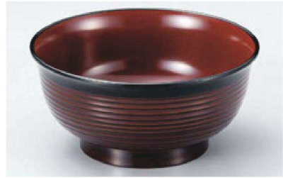
③ TA 5.3寸美里千筋丼椀 二色溜内吟朱 W-9-5 ¥2,100 (15.8φ×7.4) 楕80 740cc 142g