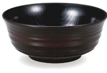
⑧ W-17-27 A 6寸千段木目丼 溜内黒 ¥1,700 (18.3φ×7.8) 楕80 1,080cc 176g