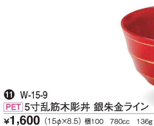
⑪ W-15-9 PET 5寸乱筋木彫丼 銀朱金ライン ¥1,600 (15φ×8.5) 楕100 780cc 136g