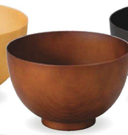
⑱ W-17-76 PET 5寸京木目丼 総ライトブラウン ¥1,900 (14.7φ×9.5) 楕100 950cc 183g