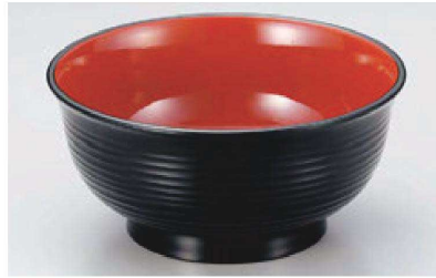
① TA 5.3寸美里千筋丼椀 黒内朱 W-9-2 ¥1,550 (15.8φ×7.4) 楕80 740cc 142g