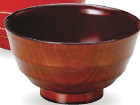
⑫ W-15-10 PET 5寸乱筋木彫丼 茶染 ¥1,950 (15φ×8.5) 楕100 780cc 136g