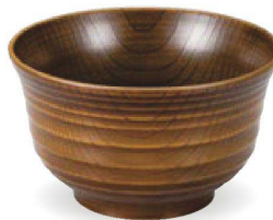
⑨ W-17-28 A 4.5寸千段木目椀 総柘刷毛目 ¥2,000 (13.5φ×8.2) 楕100 650cc 111g