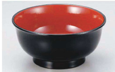
④ TA 5.3寸美里丼椀 黒内朱 W-8-95 ¥1,550 (15.8φ×7.4) 楕80 740cc 141g