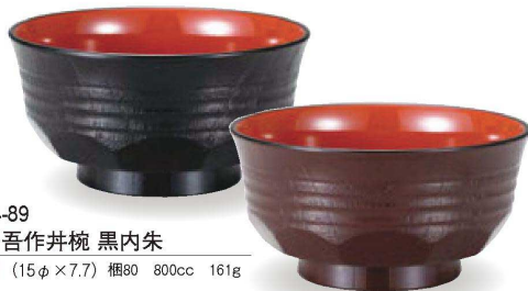
⑮ W-14-89 A 5寸田吾作丼椀 黒内朱 ¥1,600 (15φ×7.7) 楕80 800cc 161g