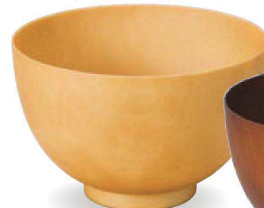
⑰ W-17-75 PET 5寸京木目丼 総ナチュラル ¥1,900 (14.7φ×9.5) 楕100 950cc 183g