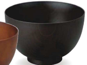
⑲ W-17-77 PET 5寸京木目丼 総ダークブラウン ¥1,900 (14.7φ×9.5) 楕100 950cc 183g