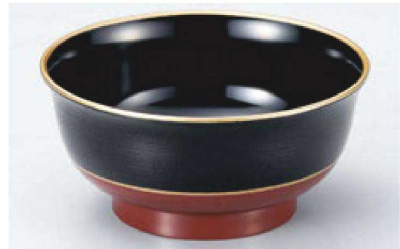
⑥ TA 5.3寸美里丼椀 刷毛目塗り分け天金 W-8-99 ¥2,150 (15.8φ×7.4) 楕80 740cc 141g