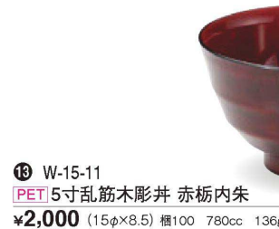
⑬ W-15-11 PET 5寸乱筋木彫丼 赤柘内朱 ¥2,000 (15φ×8.5) 楕100 780cc 136g