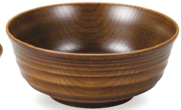
⑩ W-17-29 A 6寸千段木目丼 総柘刷毛目 ¥2,500 (18.3φ×7.8) 楕80 1,080cc 176g