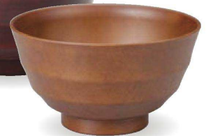
⑭ W-20-16 PET 5寸乱筋木彫丼 ブラウン ¥1,950 (15φ×8.5) 楕100 780cc 136g