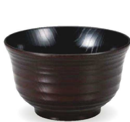
⑦ W-17-26 A 4.5寸千段木目椀 溜内黒 ¥1,250 (13.5φ×8.2) 楕100 650cc 111g