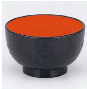
④ W-12-71 A 5寸桐木目丼 黒内朱 ¥1,000 (14.5φ×8.5) 梱100 870cc 139g