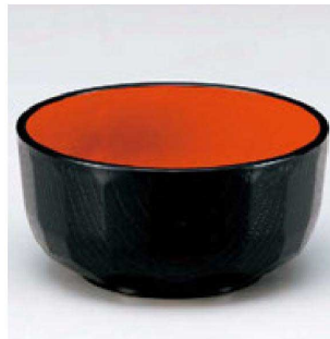
① W-11-13 A 4.8寸亀甲木目丼 黒内朱 ¥800 (14.4φ×7) 梱100 820cc 133g