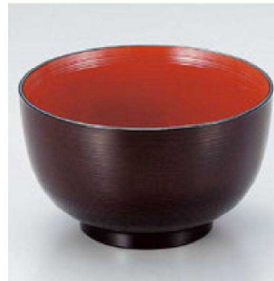
⑥ W-9-8 TA 4.5寸刷毛目羽反丼 溜内朱 ¥1,200 (13.4φ×8) 梱100 770cc 135g