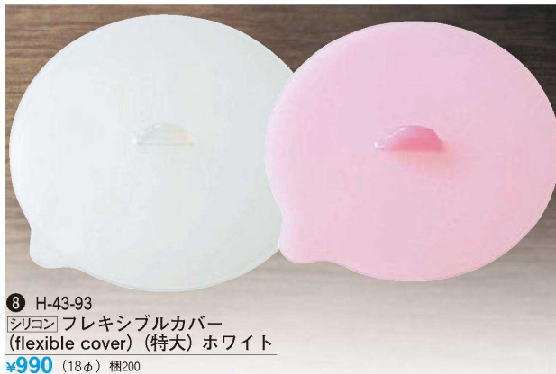
⑧ H-43-93 シリコン フレキシブルカバー (flexible cover) (特大) ホワイト ¥990 (18φ) 梱200