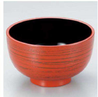
⑦ W-9-9 TA 4.5寸布目筋入丼 朱かすり ¥1,550 (13.6φ×8) 梱100 770cc 135g