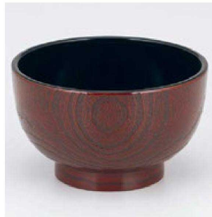
⑤ W-12-72 A 5寸桐木目丼 トチ内黒 ¥1,500 (14.5φ×8.5) 梱100 870cc 139g