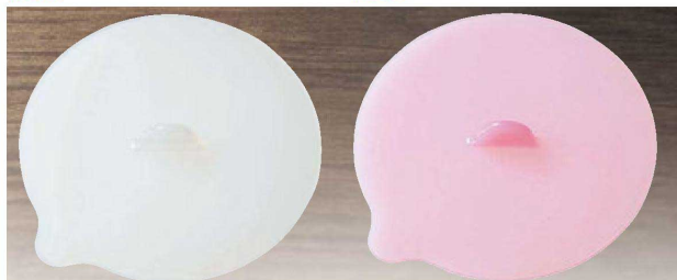
⑪ H-41-59 シリコン フレキシブルカバー (flexible cover) (小) ホワイト ¥920 (10φ) 梱300