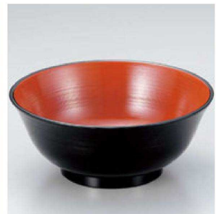
③ W-9-10 A 6寸刷毛目羽反丼 黒内朱 ¥1,300 (18.5φ×7.7) 梱90 1,050cc 190g