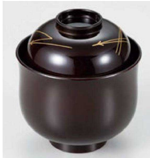
⑤ W-17-42 床質 3寸百合型小吸椀 溜 松葉 ¥4,800 (9φ×9.5) 椀100