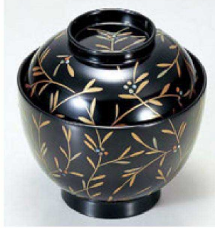
⑬ 1-194-13 床質 3.4寸玉子型小吸椀 黒南天 本漆塗 磨手描蒔絵 ¥30,000 (10.1φ×10.7) 椀100