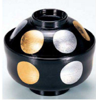
⑯ W-2-77 床質 ひさご型煮物椀 黒刷毛目金銀日月 本漆塗手描蒔絵 ¥20,000 (13φ×11.6) 椀100