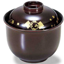
④ 1-194-2 床質 チューリップ小吸椀 溜色紙 本漆塗 蒔絵 ¥6,250 (8.6φ×8.5) 椀100