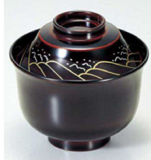
⑩ 1-194-8 床質 富士羽反小吸椀 溜波 本漆塗 蒔絵 ¥7,100 (9.9φ×9.3) 椀100