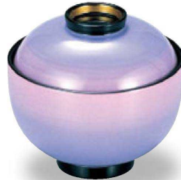
③ W-8-15 床質 姫椀 華やかかすり S・H塗 ¥4,300 (8.2φ×7.7) 椀100