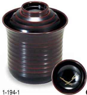
① 1-194-1 床質 箸洗椀 溜見返松葉 溜 手描蒔絵 ¥4,500 (7.5φ×8.7) 椀100