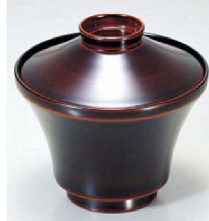
⑪ 1-194-11 床質 富士型吸物椀 溜内黒 本漆塗 ¥6,400 (10.5φ×10.1) 椀100