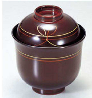
⑥ 1-194-4 床質 姫小吸椀 溜結び 本漆塗 手描蒔絵 ¥5,900 (8.4φ×9.6) 椀100