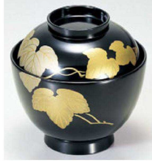
⑭ 1-194-14 床質 ナツメ型吸椀 黒ツタ 本漆塗 蒔絵 ¥6,700 (10.3φ×10.2) 椀100