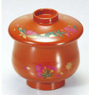
⑨ 1-194-7 床質 ひさご吸椀 朱にのし 本漆塗 蒔絵 ¥5,900 (8φ×9.3) 椀100