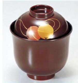
⑦ 1-194-5 床質 姫小吸椀 溜すず 本漆塗 手描蒔絵 ¥8,600 (8.4φ×9.6) 椀100