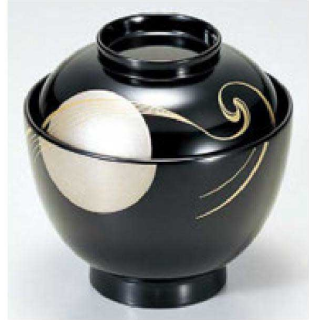
⑫ 1-194-12 床質 ナツメ型吸椀 黒日月波 本漆塗 蒔絵 ¥6,600 (10.3φ×10.2) 椀100