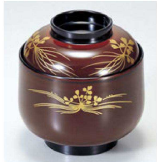
⑧ 1-194-6 床質 えびす小吸椀 溜セリ 本漆塗 蒔絵 ¥6,600 (8.8φ×9.4) 椀100