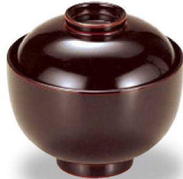
② W-8-14 床質 姫椀 溜 本漆塗 ¥5,800 (8.2φ×7.7) 椀100