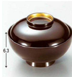
⑮ W-6-87 TM 4.2寸仙才丸椀 溜つば金 ¥3,000 (12.8φ×9.2) 椀100 270cc 181g