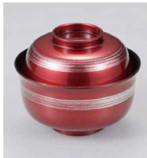
⑩ W-19-20 TM 4寸羽反椀 ワイン銀かすみライン ¥4,500 (12.1φ×9.6) 椀100 330cc 162g