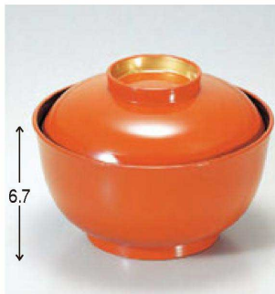
⑬ 1-201-4 A 4.2寸千鳥椀 朱つば金 ¥1,950 (12.5φ×9.3) 椀100 400cc 171g