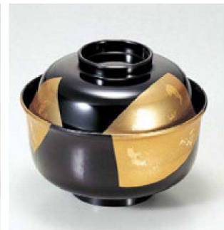
⑫ 1-201-11 TM 4寸羽反椀 黒色紙金箔 ¥4,650 (12.1φ×9.6) 椀100 330cc 162g