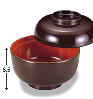
③ W-6-85 TA 洗琳椀 溜内朱 ¥2,200 (11.9φ×9.4) 椀100 340cc 151g