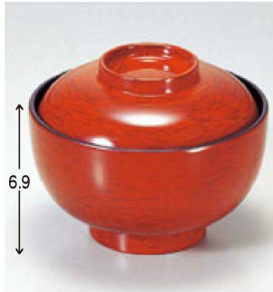
① 1-202-1 TA 4寸仙才丸椀 後藤塗 ¥2,200 (11.8φ×9.1) 椀100 350cc 140g