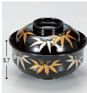
⑭ W-2-54 TM 4.2寸天竜寺椀 黒笹 ¥4,750 (12.6φ×9) 椀100 320cc 165g