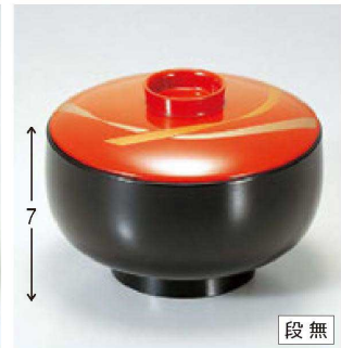
⑧ 1-199-8 M 4寸百万石椀 日の出塗裏黒花帯 ¥3,700 (12.5φ×9.2) 椀100 530cc 228g