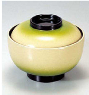
② 1-202-2 TA 4寸仙才丸椀 グリーンぼかし ¥2,350 (11.8φ×9.1) 椀100 350cc 140g