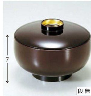
⑦ 1-199-7 M 4寸百万石椀 溜つば金 ¥3,350 (12.5φ×9.2) 椀100 530cc 228g