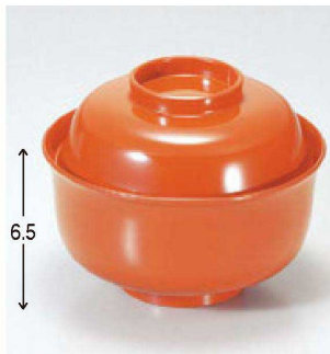
⑨ 1-201-7 TM 4寸羽反椀 総洗朱 ¥2,650 (12.1φ×9.6) 椀100 330cc 162g