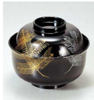
⑪ 1-201-10 TM 4寸羽反椀 黒金銀若松 ¥5,050 (12.1φ×9.6) 椀100 330cc 162g