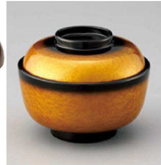
④ W-6-86 TA 洗琳椀 アクアイエロー ¥3,950 (11.9φ×9.4) 椀100 340cc 151g