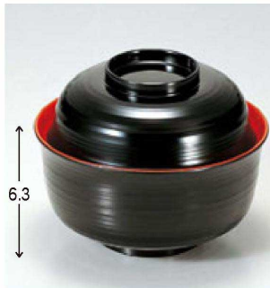
⑤ 1-199-10 TA 4寸千筋羽反椀 黒内朱 ¥2,100 (12φ×9.5) 椀100 310cc 142g