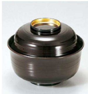
⑥ 1-199-11 TA 4寸千筋羽反椀 溜つば金 ¥2,550 (12φ×9.5) 椀100 310cc 142g