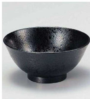
⑦ W-13-52 TA 刷毛目飯椀 総黒石目 ¥900 (12φ×5.5) 椀200 330cc 67g