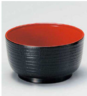
① TA 割子飯椀 (小) W-13-45 黒 ¥550 (11.4φ×6.2) 椀200 400cc 83g W-13-46 黒内朱塗 ¥700 (11.4φ×6.2) 椀200 400cc 83g