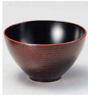
④ W-13-49 PET 4寸つぼみ木目椀 溜春慶内黒 ¥1,150 (12φ×6.9) 椀200 370cc 68g