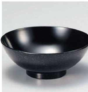
⑮ W-13-61 TA 茶漬飯椀 黒油滴 ¥1,150 (14.7φ×5.7) 椀200 460cc 82g