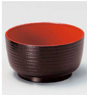
② W-13-47 TA 割子飯椀 (小) 溜内朱塗 ¥750 (11.4φ×6.2) 椀200 400cc 83g