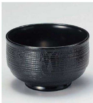
⑨ W-13-54 TA 助六飯椀 黒 ¥850 (11.5φ×7.2) 椀200 480cc 114g