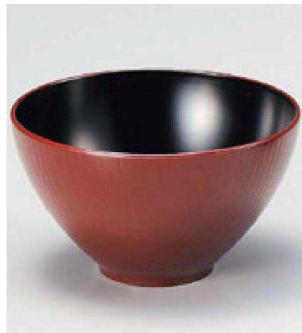
③ W-13-48 TA 4寸つぼみ木目椀 銀朱内黒 ¥1,000 (12φ×6.9) 椀200 370cc 68g