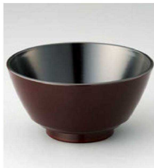
⑥ W-20-95 TA 赤坂飯椀 新溜内黒塗 ¥750 (12.2φ×6.2) 椀100 360cc 71g