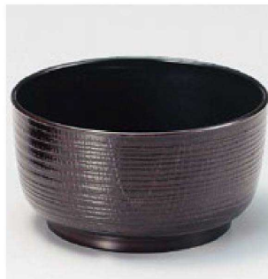
⑭ W-13-60 TA 割子飯椀 溜 ¥750 (12.5φ×6.7) 椀200 600cc 77g