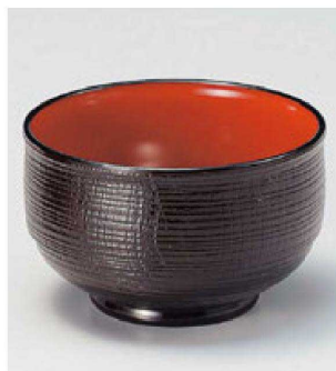
⑩ W-13-55 TA 助六飯椀 新溜内朱塗 ¥1,050 (11.5φ×7.2) 椀200 480cc 114g