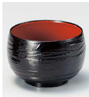
⑫ W-13-57 TA 宝飯椀 溜内朱塗 ¥1,700 (11.7φ×7.8) 椀200 500cc 163g