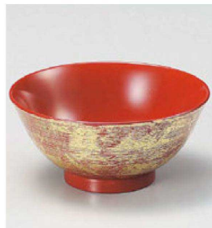
⑧ W-13-53 TA 刷毛目飯椀 朱金箔内朱塗 ¥1,800 (12φ×5.5) 椀200 330cc 67g