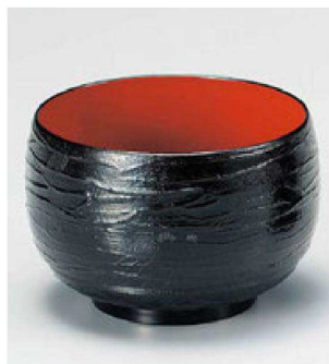
⑪ W-13-56 TA 宝飯椀 黒内朱塗 ¥1,550 (11.7φ×7.8) 椀200 500cc 163g