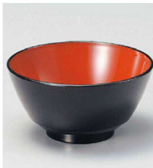
⑤ W-13-50 TA 赤坂飯椀 黒内朱塗 ¥800 (12.2φ×6.2) 椀200 360cc 71g