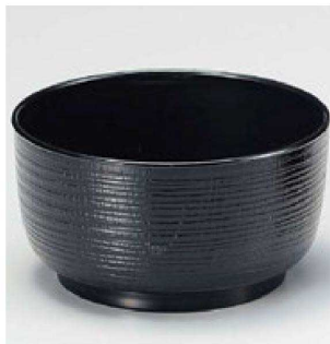
⑬ W-13-58 TA 割子飯椀 黒 ¥650 (12.5φ×6.7) 椀200 600cc 77g W-13-59 TA 割子飯椀 黒内朱塗 ¥750 (12.5φ×6.7) 椀200 600cc 77g