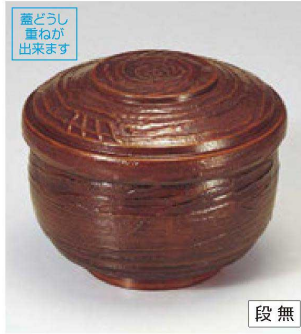
15 1-222-6 A 宝飯器 枋内黒塗 ¥2,400 (12.2φ×9.5・内寸10.3φ×6.7) 積100 500cc 231g