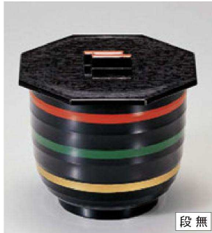
2 1-226-2 A ロクロ目飯器 ロクロ筋 ¥2,000 (11.2φ×10.2・内寸9.4φ×7.9) 積100 420cc 126g