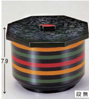
3 W-8-26 A 江戸飯器 ロクロ内朱 ¥1,900 (12.3×11.4×8.6・内寸10φ×7.1) 積80 500cc 153g