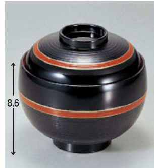
8 W-7-90 A 卵型飯器 黒に帯朱内朱 ¥2,350 (12φ×11.7・内寸11φ×7.1) 積100 500cc 192g