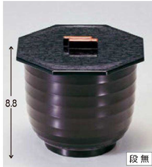
1 1-226-1 A ロクロ目飯器 うるみ ¥1,800 (11.2φ×10.2・内寸9.4φ×7.9) 積100 420cc 126g