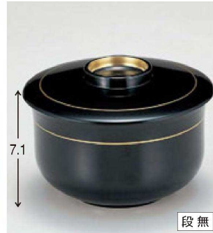
4 1-228-21 A 百合型飯器 黒金ラインつば金ライン内黒塗 ¥1,450 (12.5φ×8.7・内寸11.1φ×6.3) 積80 550cc 130g