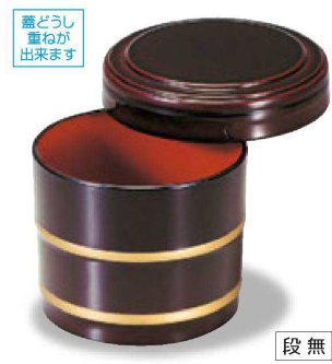
10 1-225-8 A 桶飯器 溜帯金内朱 ¥2,000 (11φ×8.8・内寸9.5φ×7.4) 積100 470cc 138g