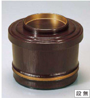
6 1-225-2 A 竹型飯器 溜内朱つば金 ¥1,950 (11.6φ×9.4・内寸10φ×6.3) 積100 420cc 160g