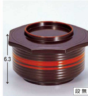
12 W-1-92 木質 3.6寸浅型線筋飯器 うるみライン内黒塗 ¥2,600 (12.7×11.8×7.5・内寸10.5φ×5.5) 積100 440cc 152g