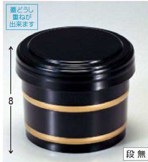
9 1-225-7 A 桶飯器 黒帯金内朱 ¥1,900 (11φ×8.8・内寸9.5φ×7.4) 積100 470cc 138g