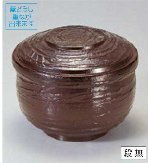
14 1-222-5 A 宝飯器 溜内朱 ¥2,000 (12.2φ×9.5・内寸10.3φ×6.7) 積100 500cc 231g