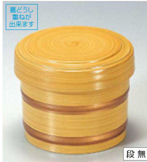
11 1-225-9 A 桶飯器 白木帯金内朱 ¥2,150 (11φ×8.8・内寸9.5φ×7.4) 積100 470cc 138g