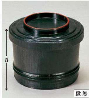
5 1-225-1 A 竹型飯器 グリーン内朱天朱 ¥1,400 (11.6φ×9.4・内寸10φ×6.3) 積100 420cc 160g