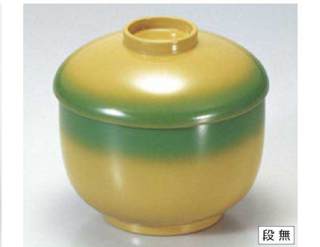
⑫ TM三笠飯椀 うぐいすかすみ内黒塗 1-223-2 ¥3,750 (11.6φ×10.6・内寸10.3φ×6.8) 積100 500cc 184g