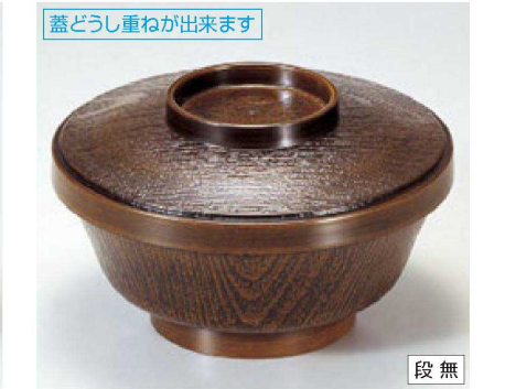
⑨ Aまゆ型飯器 枺内朱 1-225-6 ¥1,700 (14.9φ×9・内寸13.3φ×6.5) 積100 540cc 158g