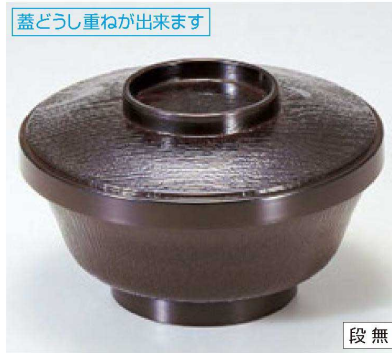
⑧ Aまゆ型飯器 溜 1-225-5 ¥1,400 (14.9φ×9・内寸13.3φ×6.5) 積100 540cc 158g