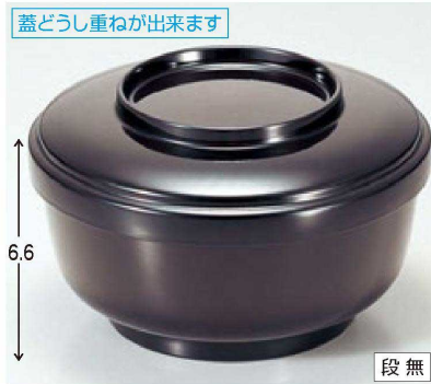
④ M加伏飯器 溜内黒塗 1-227-3 ¥1,850 (14.3φ×8.7・内寸13φ×5.7) 積100 620cc 216g