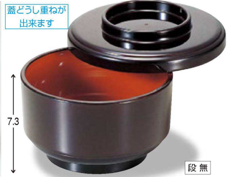
③ TA4寸切立加伏飯器 溜内朱 1-227-10 ¥2,150 (13.6φ×8.7・内寸11.6φ×6) 積100 200g