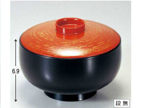
⑥ M百万石飯器 金かすみ内黒塗 1-226-8 ¥2,950 (12.5φ×9.2・内寸12φ×6.5) 積100 520cc 226g