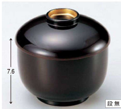
⑪ TM三笠飯椀 溜内朱つば金 W-10-14 ¥3,300 (11.6φ×10.6・内寸10.3φ×6.8) 積100 500cc 184g