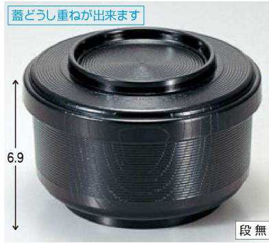
② A千筋ケヤキ飯器 黒内朱 1-227-4 ¥1,650 (13φ×8.5・内寸11.5φ×6) 積100 550cc 156g