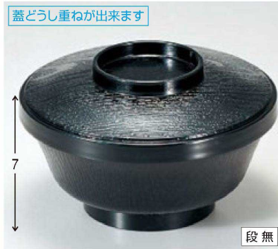
⑦ Aまゆ型飯器 黒内朱 1-225-4 ¥1,300 (14.9φ×9・内寸13.3φ×6.5) 積100 540cc 158g