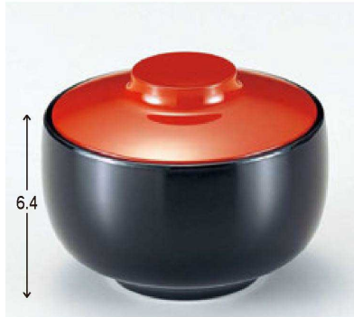
⑤ TM3.6寸春日椀 赤/黒内黒塗 限定品 W-5-84 ¥2,400 (10.5φ×8.2・内寸10.1φ×5.9) 積100 330cc 163g