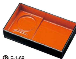
⑫ F-1-69 A平安箱 黒内朱 ¥1,600 (20.2×11.9×4.4) 梱80