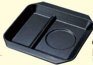
⑰ J-10-16 Mコーススタートレー ブラック ¥800 (16.2×16×1.8) 梱100 (メラミン樹脂)