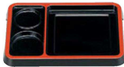
⑩ 1-442-7 A宴パーティー皿 黒天朱 (オプション別売) ¥1,450 (25.7×18.2×2) 梱80