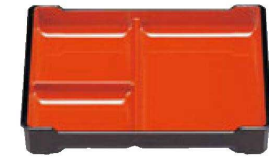
② Aミニプレート 朱天黒 1-442-2 ¥1,450 (22.3×16.4×4) 梱80