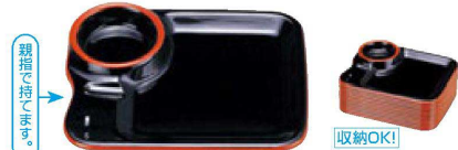
③ A立食パーティー皿 黒天朱 1-442-3 ¥1,000 (21.5×17.5×3) 梱100