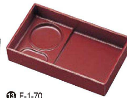
⑬ F-1-70 A平安箱 銀朱 ¥1,650 (20.2×11.9×4.4) 梱80