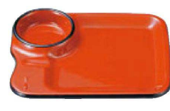
④ A立食パーティー皿 朱天黒 M-12-41 ¥1,100 (21.5×17.5×3) 梱100