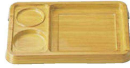
⑪ M-12-42 A宴パーティー皿 白木 (オプション別売) ¥1,550 (25.7×18.2×2) 梱80