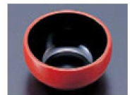
⑭ A2.3寸丸鉢 朱内黒 1-339-22 ¥430 (7φ×3.6) 梱200