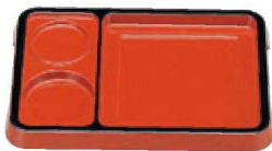
⑧ A宴パーティー皿 朱天黒 1-442-6 (オプション別売) ¥1,450 (25.7×18.2×2) 梱80