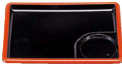
⑥ 1-442-5 A立食プレート 黒天朱 ¥650 (18.3×13.6×1.3) 梱200