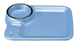
⑤ A立食パーティー皿 ブルー真珠天黒 1-711-2 ¥1,200 (21.5×17.5×3) 梱100