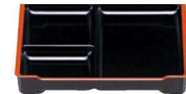
① Aミニプレート 黒天朱 1-442-1 ¥1,450 (22.3×16.4×4) 梱80