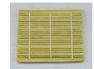
⑮ 笹竹ス 1枚 S-8-97 ¥400 (11×11)