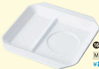
⑯ J-10-15 Mコーススタートレー ホワイト ¥800 (16.2×16×1.8) 梱100 (メラミン樹脂)