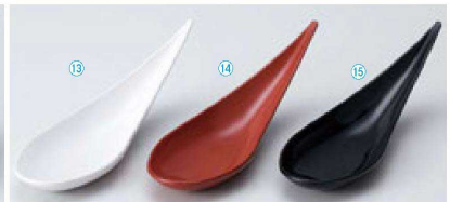
TA スプーン珍味入 (15.5×4.9×4.7) 個400