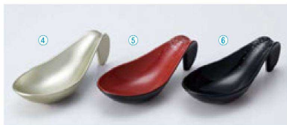
TA プチレンゲ珍味入 (11.8×4.8×3.3) 個400