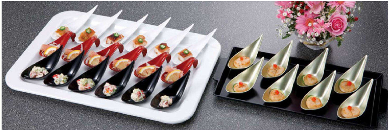
耐熱 プチレンゲ珍味入