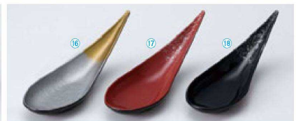
TA スプーン珍味入 (15.5×4.9×4.7) 個400