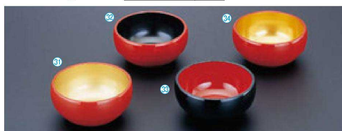
A 2.6寸丸鉢 (8φ×3.6) 個200