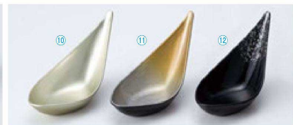
TA プチしずく珍味入 (12.5×5.2×7) 個400