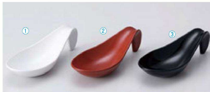
TA プチレンゲ珍味入 (11.8×4.8×3.3) 個400