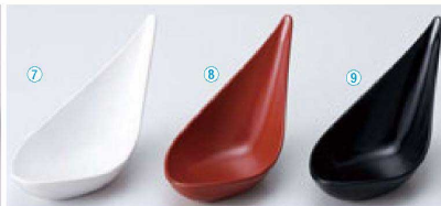
TA プチしずく珍味入 (12.5×5.2×7) 個400