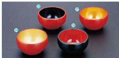
A 2.3寸丸鉢 (7φ×3.6) 個300