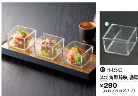
⑬ H-155-92 AC 角型珍味 透明 ¥290 (5.5×5.5×3.7)