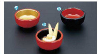
A ミニ丸鉢 (6.3φ×3.1) 個300