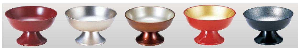
マリノカップ (容量175cc)