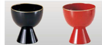
小丸ぐい呑み (容量65cc)