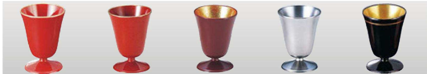
ミニワイングラス (容量26cc)