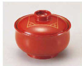
① M-9-43 木質 大口ミニ椀 黒日月内金雅 ¥4,700 (7.3φ×4.8) 梱200