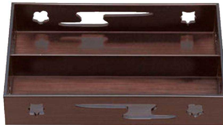
② A9寸春日透かし盛器 溜内塗 1-304-2 ¥4,000 (28×17.9×5.6) 梱40