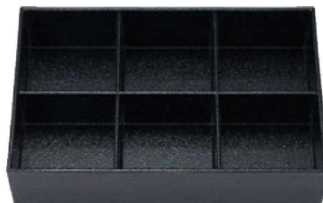
⑬ A8.5寸固定六点珍味箱 黒石目内塗 M-23-52 ¥2,600 (25.6×17.2×H5.8)