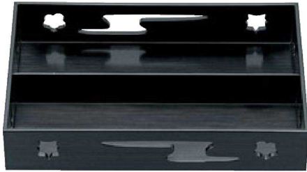
① A9寸春日透かし盛器 黒内塗 1-304-1 ¥3,400 (28×17.9×5.6) 梱40