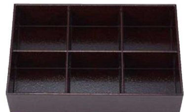
⑭ A8.5寸固定六点珍味箱 新溜石目内塗 M-23-53 ¥2,800 (25.6×17.2×H5.8)