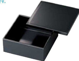
⑧ M-39-64 A 4寸前菜箱 蓋 総黒塗 ¥700 (12.5×12.5×1.4) 柵120 ⑨ M-39-65 身 総黒塗 ¥1,500 (12.5×12.5×5.3) 柵60