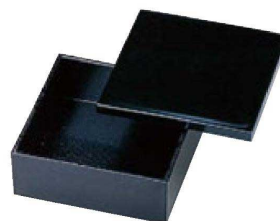
⑩ M-5-99 A 4.5寸前菜箱 蓋 黒内新黒石目塗 ¥1,100 (13.5×13.5×1.2) 柵120 ⑳ M-6-1 身 黒内新黒石目塗 ¥1,800 (13.5×13.5×5.3) 柵60