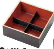
① 1-333-17 A 十字仕切 (ミニ用) 11.6cm ¥340 (11.6×11.6×2.7)厚み0.2