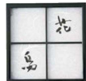
㉘ M-39-73 A 4.5寸前菜箱 障子蓋 黒塗 花鳥 ¥2,100 (13.5×13.5×1.5) 柵120