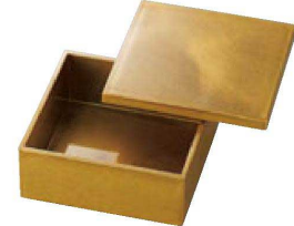
⑩ M-39-66 A 4寸前菜箱 蓋 総金雲塗 ¥1,200 (12.5×12.5×1.4) 柵120 ⑪ M-39-67 身 総金雲塗 ¥2,000 (12.5×12.5×5.3) 柵60