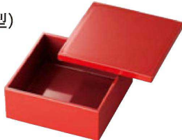
⑥ M-39-63 A 4寸前菜箱 蓋 総本朱 ¥700 (12.5×12.5×1.4) 柵120 ⑦ M-6-9 身 総本朱塗 ¥1,500 (12.5×12.5×5.3) 柵60