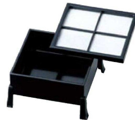
㉖ M-6-2 A 4.5寸角足付前菜箱 障子蓋 黒 ¥1,800 (13.5×13.5×1.5) 柵120 ㉗ M-14-56 身 総黒塗 ¥2,700 (15×15×7.4) 柵60