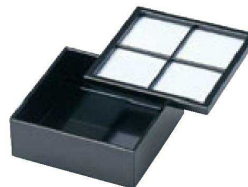
⑬ M-6-2 A 4.5寸前菜箱 障子蓋 黒 ¥1,800 (13.5×13.5×1.5) 柵120 ⑭ M-6-14 身 総黒塗 ¥1,600 (13.5×13.5×5.3) 柵60