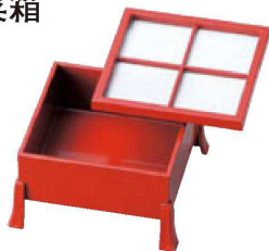
㉓ M-6-8 A 4寸角足付前菜箱 障子蓋 本朱 ¥1,700 (12.5×12.5×1.4) 柵120 ㉔ M-14-53 身 総本朱塗 ¥2,500 (14×14×7.4) 柵60