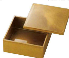
㉑ M-39-70 A 4.5寸前菜箱 蓋 総金雲塗 ¥1,300 (13.5×13.5×1.2) 柵120 ㉒ M-39-71 身 総金雲塗 ¥2,100 (13.5×13.5×5.3) 柵60