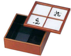
⑮ M-13-16 A 4.5寸前菜箱 障子蓋 春慶塗 花鳥 ¥2,600 (13.5×13.5×1.5) 柵120 ⑯ M-5-74 身 春慶内黒塗 ¥3,150 (13.5×13.5×5.3) 柵60