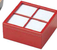
② M-6-8 A 4寸前菜箱 障子蓋 本朱 ¥1,700 (12.5×12.5×1.4) 柵120 ③ M-6-9 身 総本朱塗 ¥1,500 (12.5×12.5×5.3) 柵60