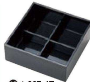
⑫ 1-667-4E A 十字仕切 (ミニ松花堂用) 12cm ¥340 (12×12×2.2) 厚み0.4