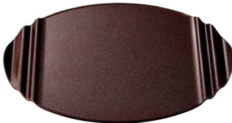
③ TA オーバルレストトレー 新溜パール B-37-81 艶消ノンスリップ加工 ¥4,550 (41.8×30×1.6) 梱40