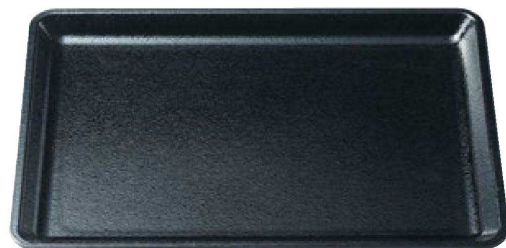
⑨ TA 尺4寸トレー 黒石目 ノンスリップ加工 B-24-43 ¥3,500 (42.4×30.2×2.1) 梱40