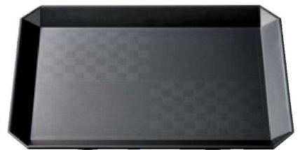
⑦ A 長方形トレー 艶消 黒 B-37-55 ¥2,600 (41.3×30.2×2) 梱40