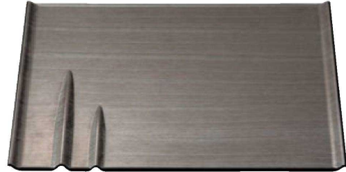
② TA スクエアレストトレー グレーウッド B-37-80 艶消ノンスリップ加工 ¥6,200 (41.6×30×1.3) 梱40