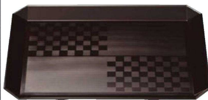
⑤ A 長方形トレー 新溜 B-24-30 ¥2,550 (41.3×30.2×2) 梱40