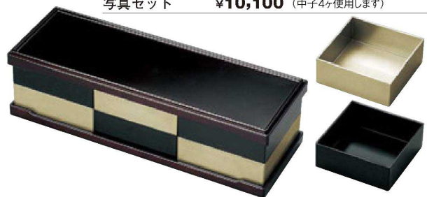
【A】尺1寸トリプルオードブル (セットサイズ: 34×11.8×9.6)