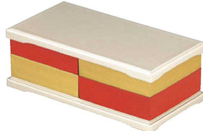
【A】尺0寸マルチオードブル