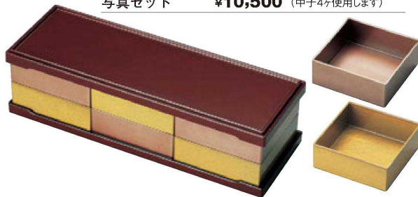
【A】尺1寸トリプルオードブル (セットサイズ: 34×11.8×9.6)