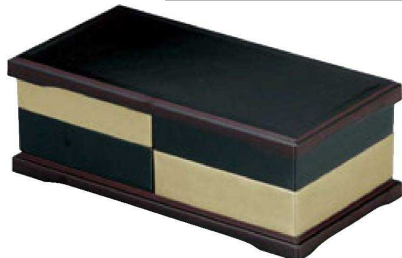
【A】尺0寸マルチオードブル